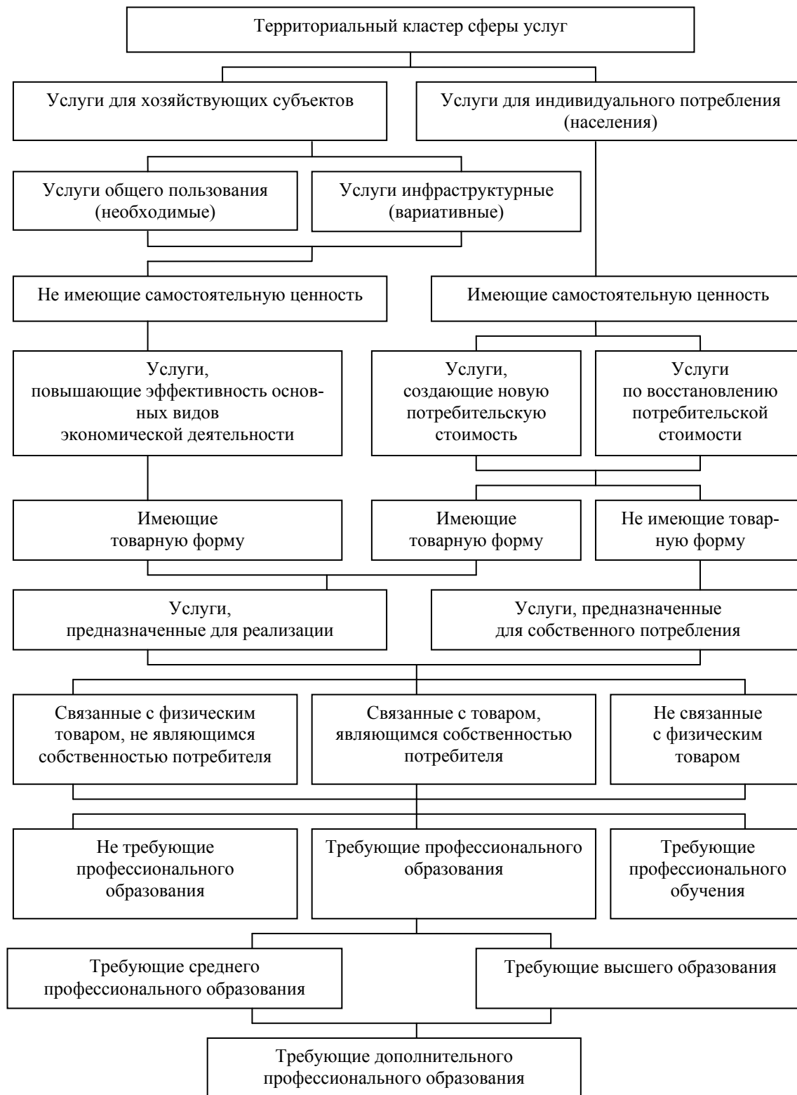
Рис. 2. Структура территориального кластера сферы услуг по классификационным группам услуг

ном, функциональном и системном подходах. С позиций ситуационного подхода услуга проявляется в способности удовлетворять определенные потребности. С позиций функционального подхода услуга является последовательностью действий и возникает в процессе взаимодействия потребителя и производителя. Существование услуг в виде деятельности превращает сферу услуг в контактную зону потребителей и производителей.