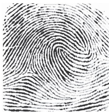
Рис. 2. Пальцевый узор "двойная петля"

различия между группами обнаруживаются в частоте самого простого узора "дуга" (рис. 3).