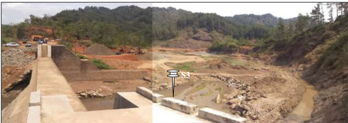
Gambar-2. Daerah hilir BPS Kedung Ringin.