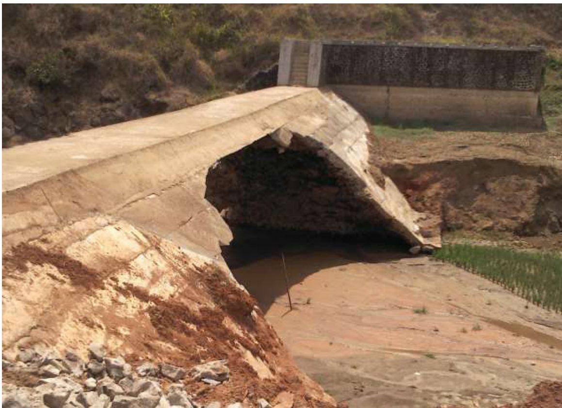
Gambar-5. Sisi hulu spillway pada BPS Kedung Ringin.

Adapun fenomena jebolnya spillway pada BPS Kedung Ringin dapat diklarifikasikan sebagai berikut: (a) Rembesan di bawah spillway memicu rongga aliran air sufosi di bawah spillway , (b) Sufosi mulai terjadi ketika muncul bocoran atau sembulan di sebelah hilir dari lantai belakang spillway ,