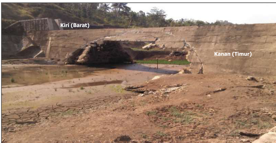
Gambar-3. Spillway pada BPS Kedung Ringin setelah jebol.