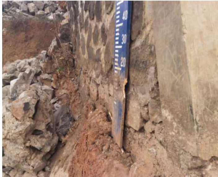
Gambar-4. Rambu ukur elevasi muka air di BPS Kedung Ringin.

bagian-bagian bangunan yang telah rusak maupun sisa-sisa reruntuhan bangunan untuk diujikan di laboratorium, (d) verifikasi gambar-gambar realisasi bangunan ( asbuilt drawing ) terhadap bagian-bagian bangunan yang masih ada dan sisa-sisa maupun bekas-bekas reruntuhan bangunan, (e) wawancara terhadap beberapa responden baik pejabat, petugas, dan masyarakat setempat yang berdomisili di sekitar lokasi bangunan, dan (f) dokumentasi bukti-bukti fisik dari bagian-bagian bangunan maupun sisa-sisa reruntuhan bangunan.