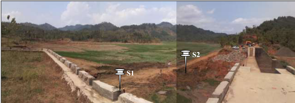
Gambar-1. Daerah hulu (tampungan air) pada BPS Kedung Ringin.