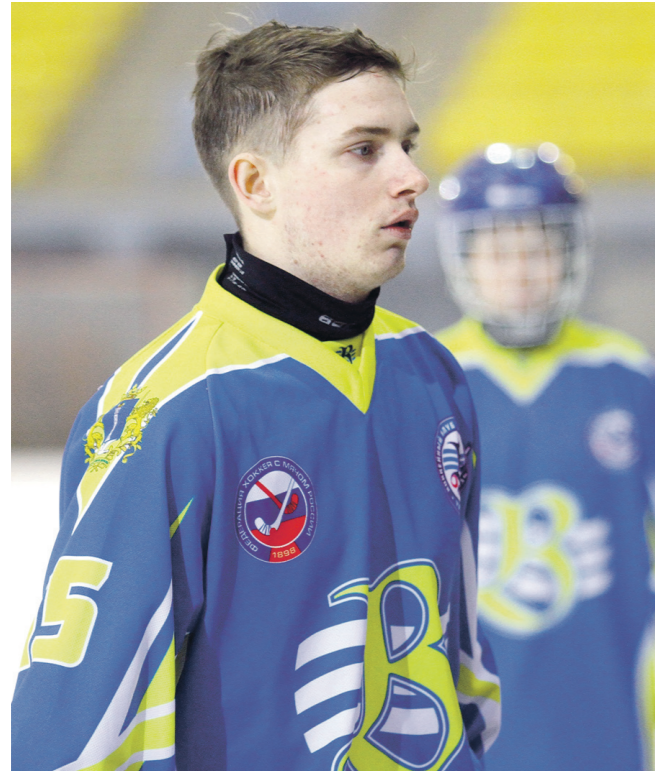
Материалы полосы подготовил Максим СКВОРЦОВ.

- Нет. Мама прекрасно понимает, что это нужно для меня, для моего развития. Не должно возникнуть трудностей и с обучением. Я уже подал документы на поступление в УлГПУ, буду учиться заочно.