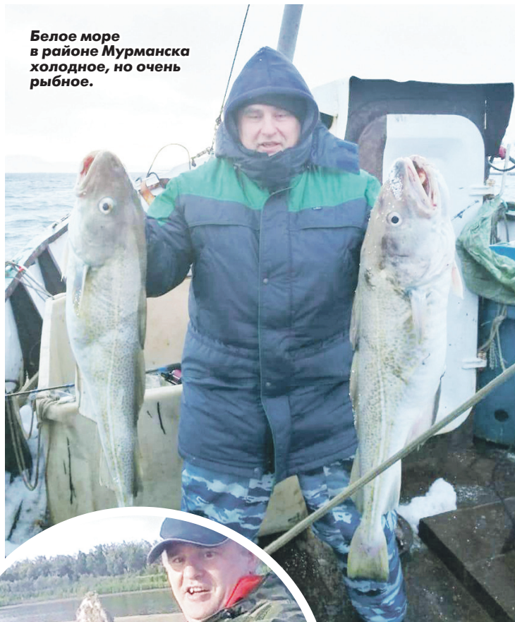
Белое море в районе Мурманска холодное, но очень рыбное.

- Очень много я рыбачил, когда жил и работал в Нижневартовске, - говорит наставник. - Там мы ездили на Обь и реку Вах. Знали все рыбные заводы. Однажды поймал на Оби щуку весом 12 кило-