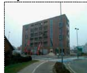
Vejlevej 8, Billund