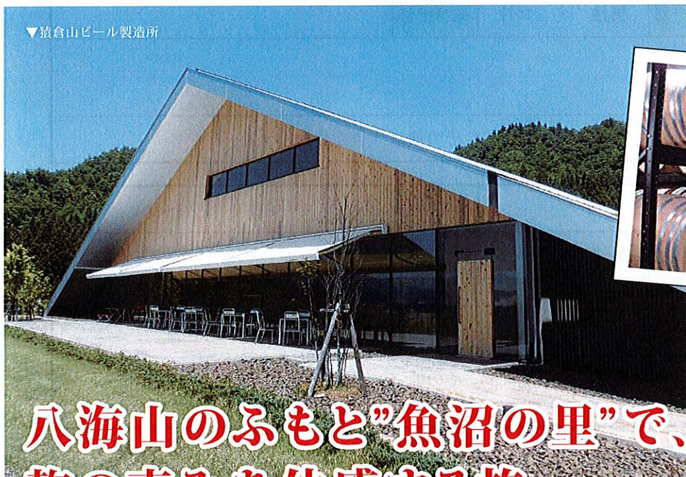
▼猿倉山ビール製造所