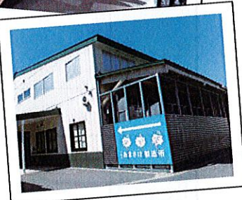
▲八海山あまさけ製造所