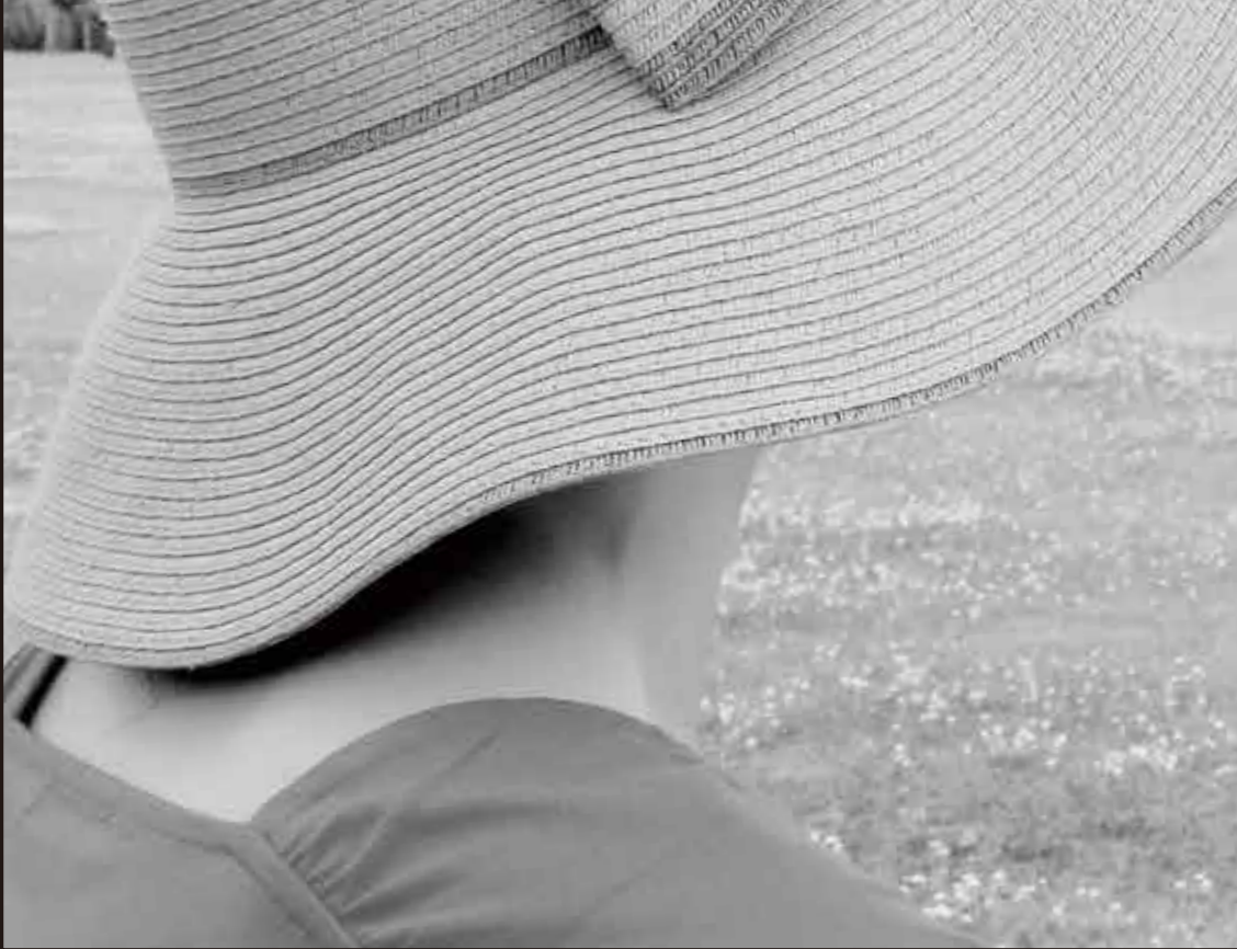
南魚沼市、湯沢町で生活する人達のくらしをみつめる地域密着版の新聞です。

湯沢町・中央保育園を会場に7月17日、第1回あつぎサミットが開かれた。このサミットは南魚沼地域の課題の一つとして、農業、商店、旅館など多方面で後継者をうつすこと、という課題があることを受け、課題の洗い出しや解決に向けての知恵を出し合うイベント。 あつぎに悩んでいる当事者以外にも、地域の将来を考えてみた人、新しいことを始めたい(始めた)人などにも参加を呼びかけて湯沢町ではあつぎサミットを開催する他、移住に関心を持つ人々を対象にする関連イベントが東区内で2回計画されている。参加者の意見交換に先立ち、地域の人口推計資料を基に