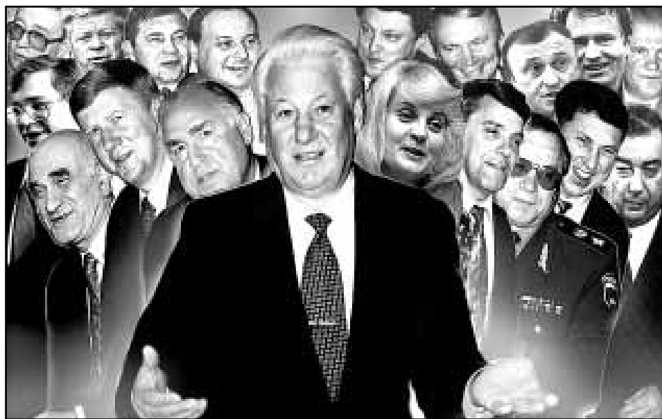
Если бы президентом остался Б. Ельцин, то в Правительстве читатели «АиФ» хотели бы видеть: