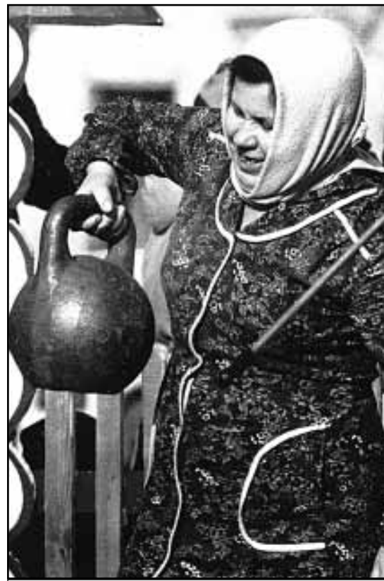
Фото Александра Метлина, г. Вышний Волочек.