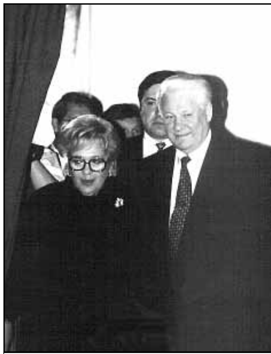
Галина Волчек и Борис Ельцин

Название пьесы Виктора Розова, постановка которой в 1956-м знаменовала рождение «Современника», - «Вечно живые» оказалась пророческим. «Современнику» - сорок лет. Для человека это парадоксальный возраст - возраст зрелости и одновременно - молодости, а для театра - опасный: еще основатели Художественного театра предупреждали о том, что даже десятилетний срок жизни творческого коллектива таит в себе угрозу закиснуть, омертветь. А уж четыре раза по десять!..