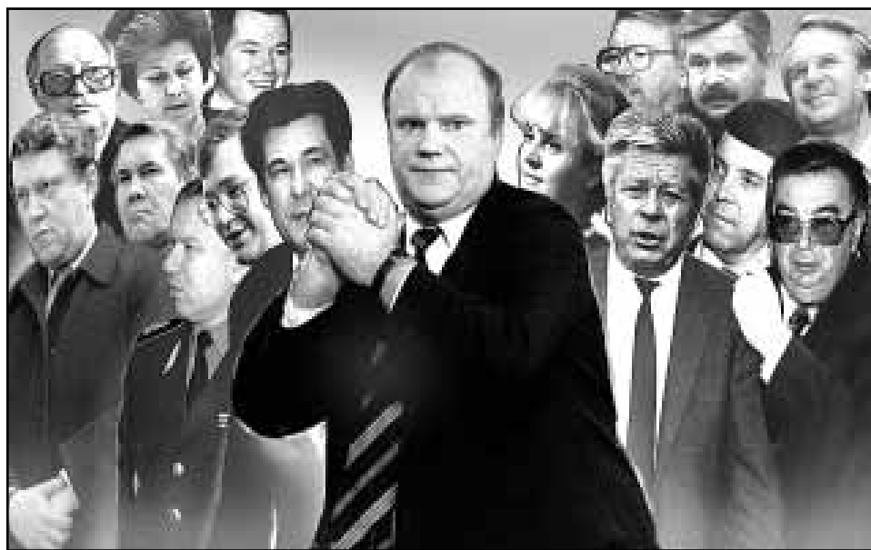
Если бы президентом стал Г. Зюганов, то в Правительстве читатели «АиФ» хотели бы видеть:

Значения процентов взяты соответственно от того числа писем, где в качестве нового президента указаны Борис Ельцин или Геннадий Зюганов.