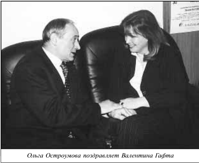
Ольга Остроумова поздравляет Валентина Гафта