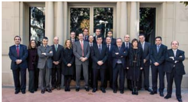
Socios de Auditoría, Riesgos y Transacciones en Cataluña, Aragón y Baleares

Deloitte es la firma líder de servicios profesionales en España. Contamos con más de 5.000 profesionales repartidos en una red de 20 oficinas en España, que permite dar un excelente nivel de respuesta a las necesidades de los clientes, tanto nacionales como internacionales.