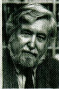
Клиффорд Гирц (р. 1926)

Американский антрополог, создатель интерпретативной антропологии, представляющей собой синтез традиций американской культурной антропологии с идеями современной герменевтики (П.Рикёр), символической философии (С.Лангер), аналитической философии языка (Л.Витгенштейн).