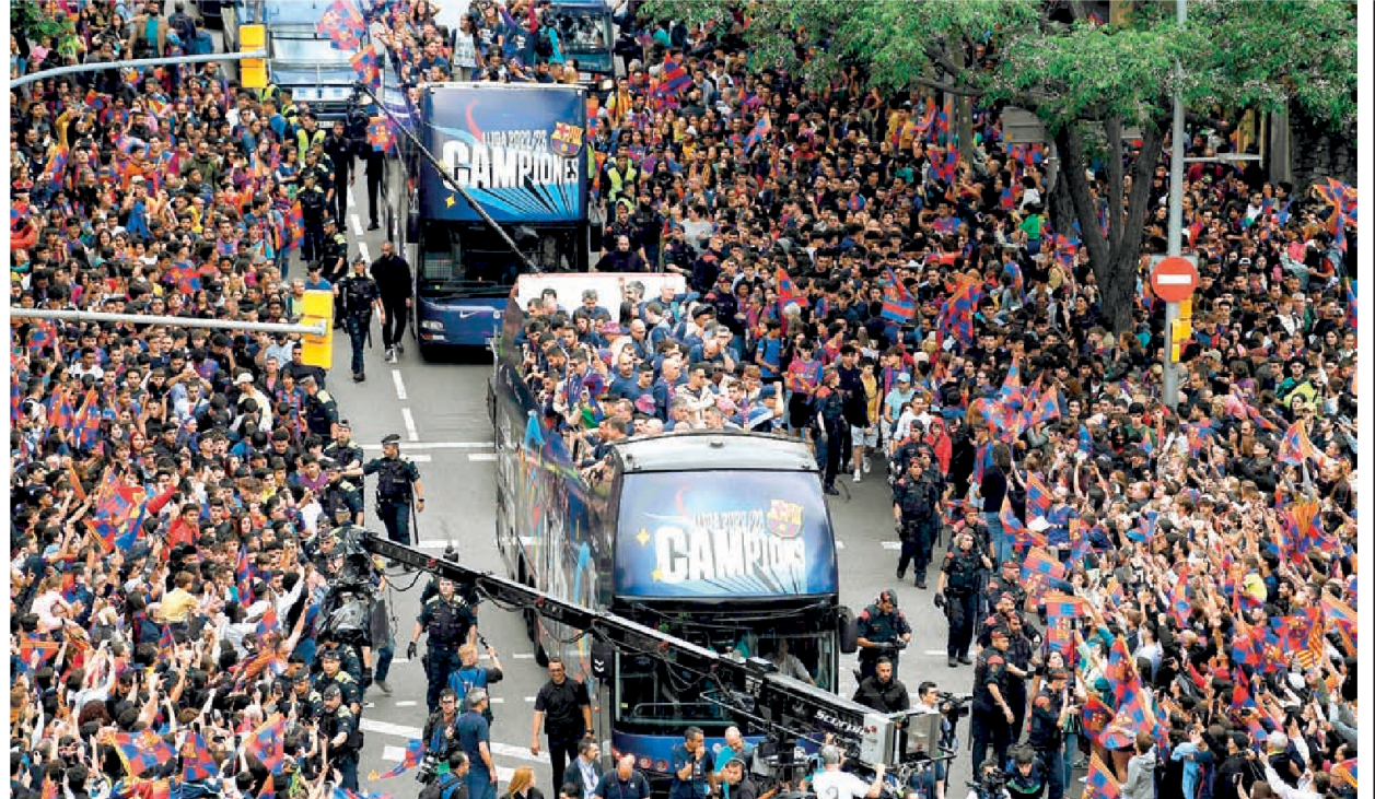
এমন দিন রোজ রোজ আসে না। জোড়া খেতাবের আনন্দে পাগলপারা বার্সা-সমর্থকেরা।