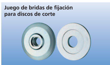
Juego de bridas de fijación para discos de corte

Brida especial de \varnothing 76 mm para husillos de máquina de M14 ó 5/8". Adecuado para el aumento de la estabilidad lateral y mejora de la transmisión de fuerzas en discos de corte.