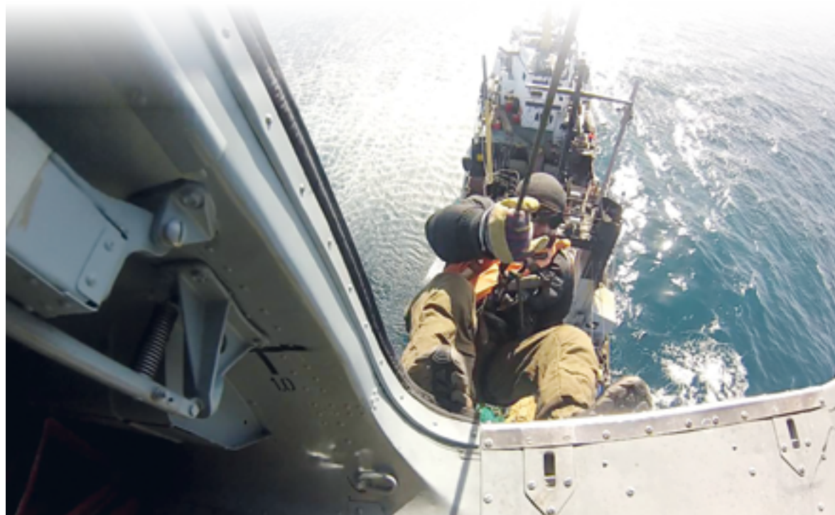
▲ Высадка с вертолета на судно-нарушитель

Вот что сообщила пресс-служба пограничного управления по Восточному Арктическому району. Краболовы были задержаны 25-26 мая