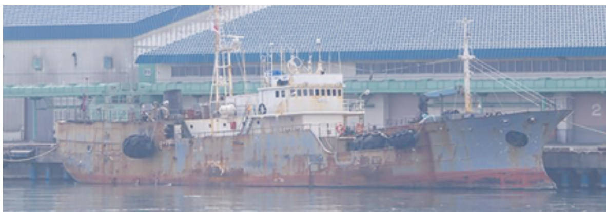
▲ «Авант» (он же «Дарт») в японском порту Огару

P. S. Обращаемся к читателям. Если у вас есть любая дополнительная информация о судах «Авант», «Фаст» и других «подфлажниках», которой вы готовы поделиться, то мы с большим интересом вас слушаем. Анонимность гарантируем.