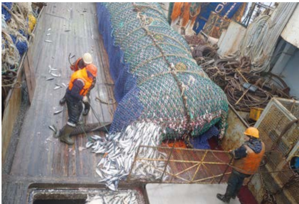
▲ На борту «Хотина»: добыча сельди

ШТОРМЫ МОГУТ ХОЗЯЙНИЧАТЬ НЕСКОЛЬКО СУТОК ПОДРЯД, СРЫВАЯ РАБОТУ ФЛОТА, А МОГУТ ПОСТОЯННО СМЕНЯТЬ ДРУГ ДРУГА, НЕ ДАВАЯ МОРЮ УСПОКОИТЬСЯ. И ТАКИХ ДНЕЙ ЗА РЕЙС БУДЕТ НЕМАЛО