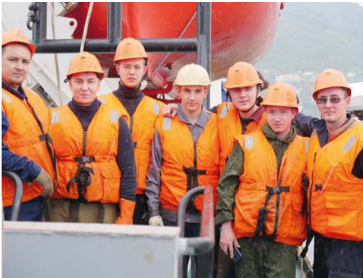
▲ Курсанты на практике в Океанрыбфлоте

«Ноябрь и декабрь – самое лютое, штормовое время», – говорят одни. «Вот уж нет, самая сложная обстановка в январе и феврале: штормы и ледовые заторы», – спорят другие. Зима в Беринговом и Охотском морях – испытание не для слабонервных, но, к счастью, для большинства моряков она делится на две части. К Новому году суда Океанрыбфлота возвращаются к причалам, новый промысловый период начинается 1 января, и у рыбаков есть возможность отметить этот волшебный праздник в кругу семьи. А после Нового года – новые трудовые будни. Чтобы на новогодних столах россиян была вкусная, нежная и свежая рыба, труженики моря сейчас ставят и выбирают тралы, 8 часов посменно перерабатывают улов и везут на берег готовую рыбопродукцию, которая не нуждается в рекламе. Филе минтая, кальмара и сельди, консервы «Печень минтая» – это отличный набор для праздничного ужина. Рыбаки Океанрыбфлота гарантируют качество. <