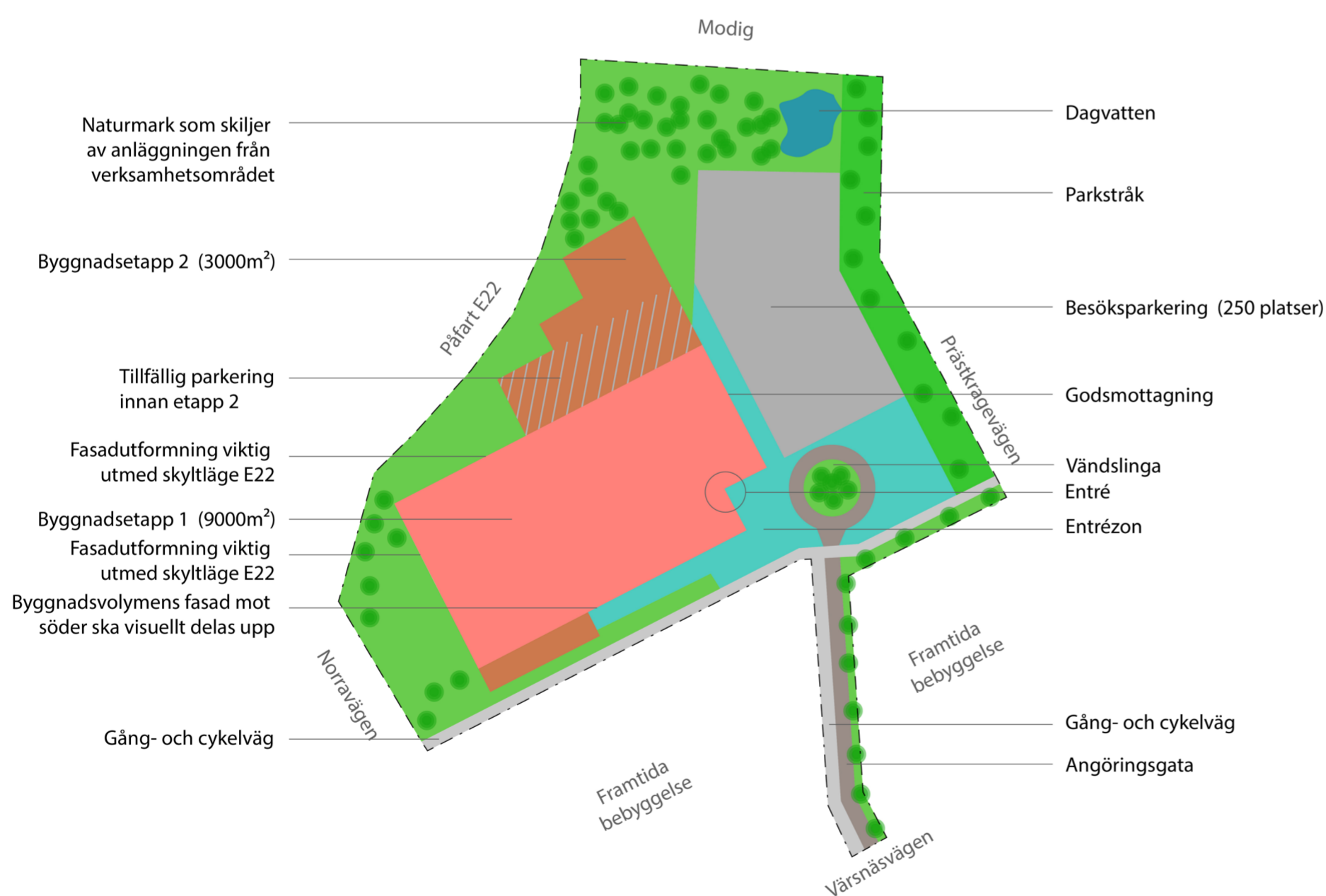
Principskiss kring uppdelning av ytor för parkering, angöring/entrétorget och grönytor vid nya bad- och friskvårdsanläggning