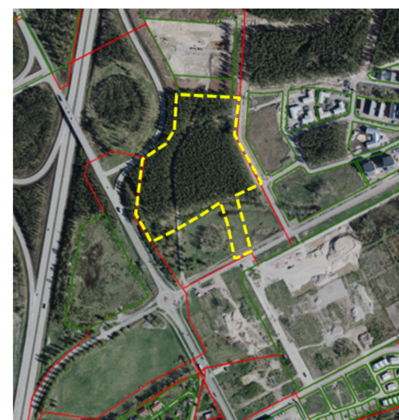
Det gulmarkerade området visar planområdets geografiska avgränsning.