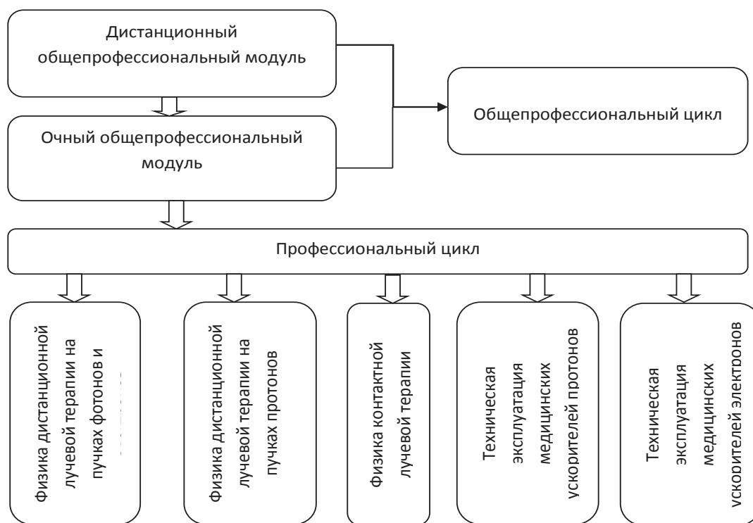
Рис. 2. Структура программы

Таким образом, подготовка медицинского физика складывается из трех составляющих: первое – это