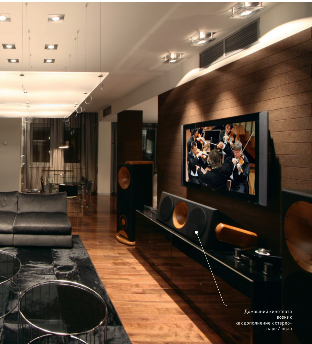
Домашний кинотеатр возник как дополнение к стереопаре Zingali