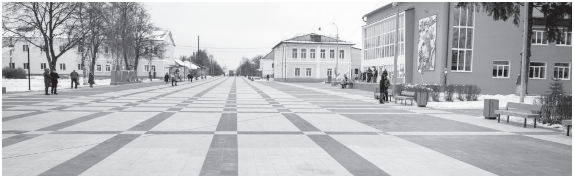
Сквер «Голубь Кантемира» в Дмитровске