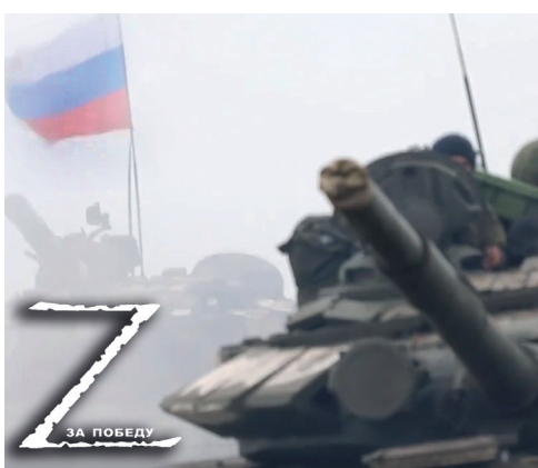
Специальная военная операция