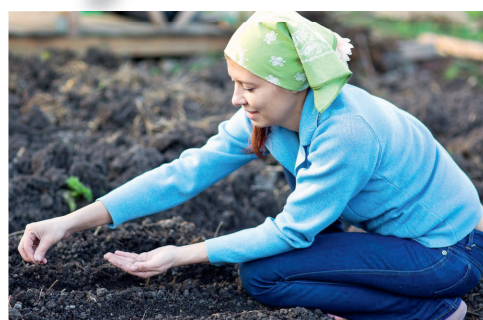
«Шуба»... с грядки