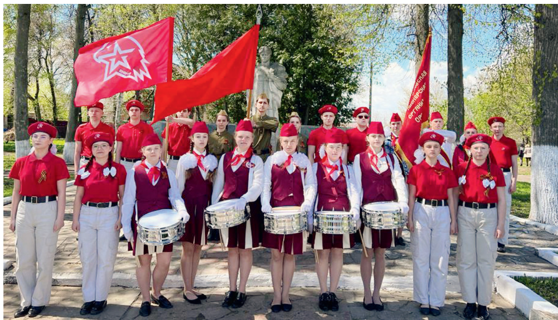
У мемориала «Скорбящая мать» в посёлке Змиёвка. 9 мая 2022 г.

Здорово, что пионерские традиции продолжают жить и развиваться в Орловской области и сегодня. В регионе успешно действует областная пионерская организация