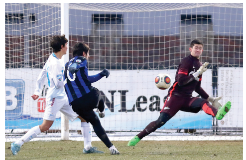
29.11.2015 Шинник — Зенит-2.