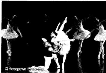
バレエ スターダンサーズ・バレエ団 (7/15~30)