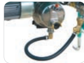
Pompa acqua Spin 15A