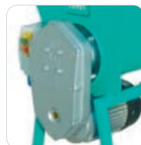
Motoriduttore IMER brevettato