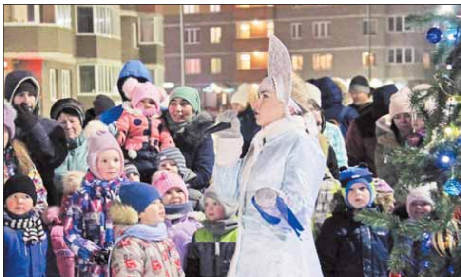
Милая Снегурочка в гости к нам пришла.

До самого волшебного и любимого миллионами праздника остается еще несколько дней, но Тверь уже погрузилась в его атмосферу. В минувшее воскресенье в городском саду, как всегда, бурно и радостно, с веселыми песнями и плясками, встречали Деда Мороза и Снегурочку. В тот же день вечером наш тверской сказочный зимний старец прибыл на предновогоднюю елку и в один из самых молодых жилых комплексов столицы Верхневолжья – Брусилово.