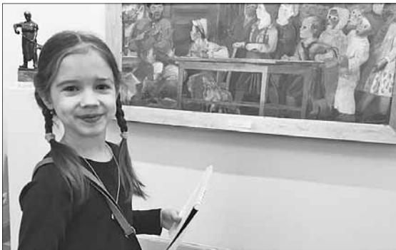
И тебя кто-нибудь нарисует.

Семейная игра «Ровесники», которую проводят сотрудники областной картинной галереи в Императорском дворце, обрастает поклонниками. За два месяца после ее появления в календаре дворцовых событий, в игровом путешествии уже побывали почти 100 ребят.