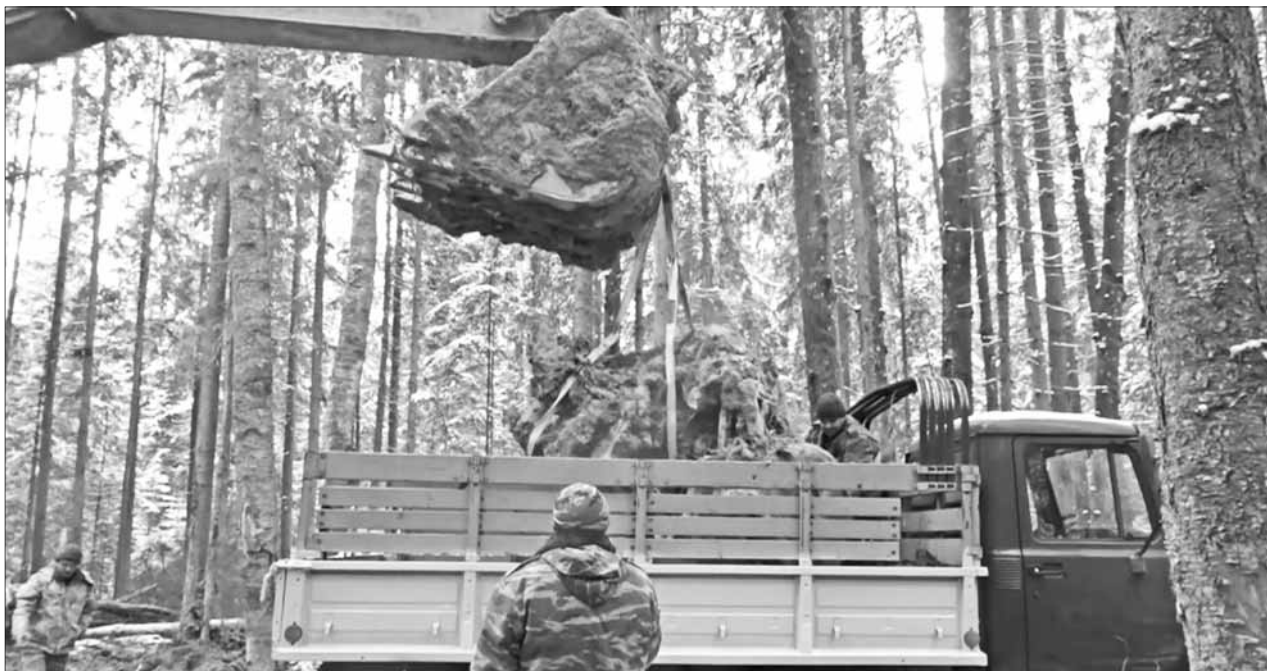
Погрузка поднятого двигателя.

О том, чем завершилась операция по подъему фрагментов боевого самолета, кто был в ней задействован и что удалось