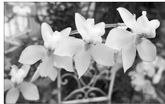
Орхидеи в ботаническом саду.

Если по каким-то причинам вы не можете отправиться в новогоднее мини-путешествие, можно весело, с пользой провести время в родном городе, да и дома.