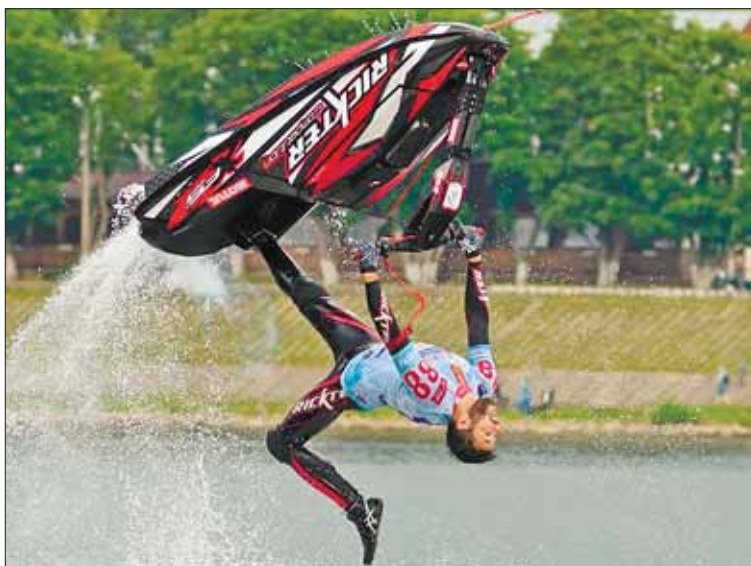
За трюками аквабайкеров и флайбордистов в Твери наблюдала вся Россия.