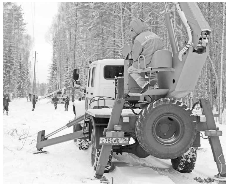
Удалось расчистить 12700 га и расширить 1103 га просек.