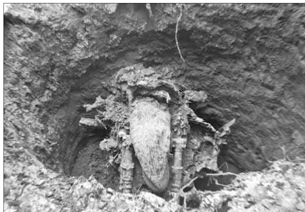
Шасси и часть двигателя.

И вот завершилась очередная операция. В ней приняли участие члены сводного поискового отряда, в который вошли общественные поисковые объединения «Звезда», «Земляки», «Исток», «Тверичи». Из забвения бережно извлекались фрагменты Пе-2.