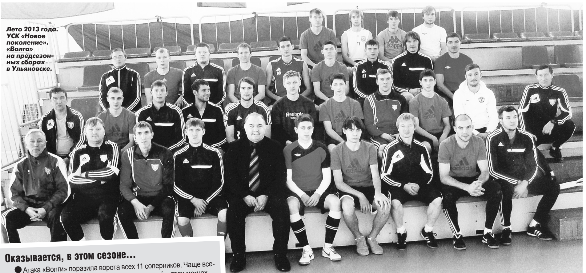
Лето 2013 года. УСК «Новое поколение». «Волга» на предсезонных сборах в Ульяновске.