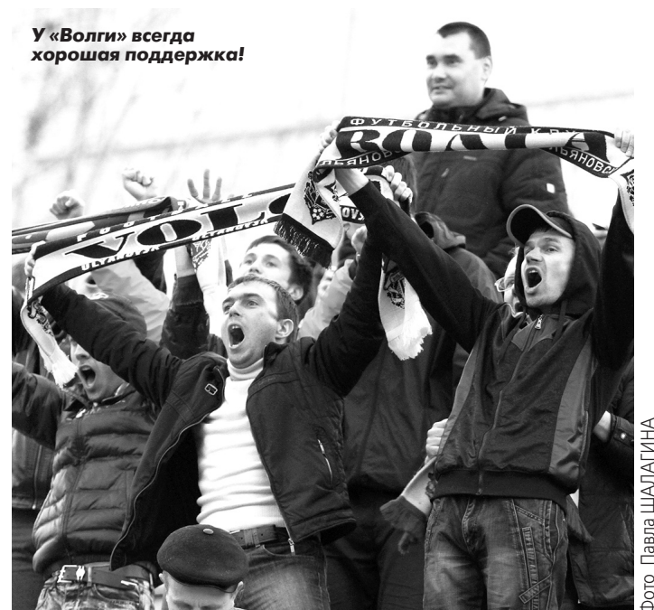
У «Волги» всегда хорошая поддержка!