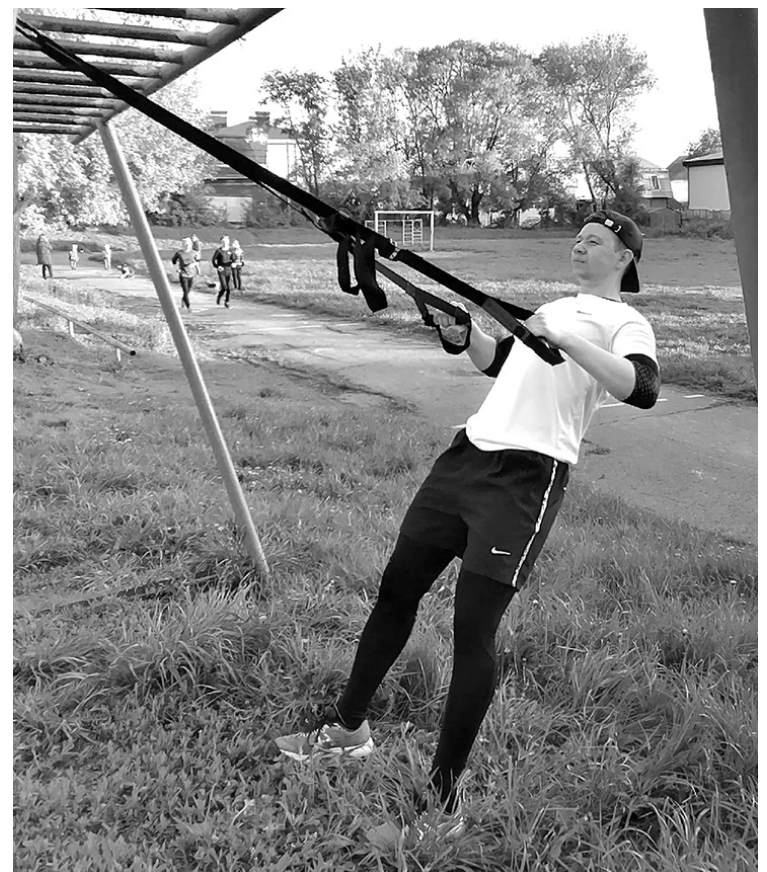
Материалы полосы подготовил Александр АГАПОВ.

- Ребята находятся в разной степени готовности, но, конечно, команда в целом растренированная, - добавляет Лежнин. - Все-таки это любительский клуб, и невозможно каждого контролировать. Два месяца у нас не было совместных тренировок, общих нагрузок. Да и от мяча уже отвыкли. Но сейчас начинаем вливаться. О сроках начала сезона данных пока нет. Профессионалы начинают соревнование вроде бы 13 июня, но при этом не известно где и как. А по любительским турнирам пока вообще ничего не знаем.