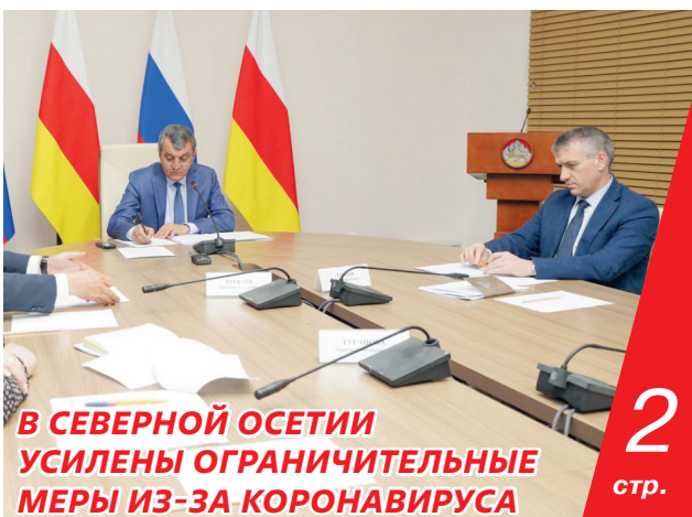
2 стр. В СЕВЕРНОЙ ОСЕТИИ УСИЛЕНА ОГРАНИЧИТЕЛЬНЫЕ МЕРЫ ИЗ-ЗА КОРОНАВИРУСА