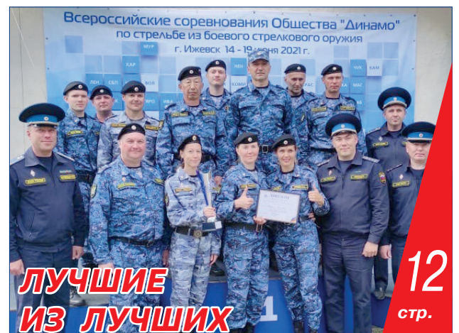
12 стр. ЛУЧШИЕ ИЗ ЛУЧШИХ