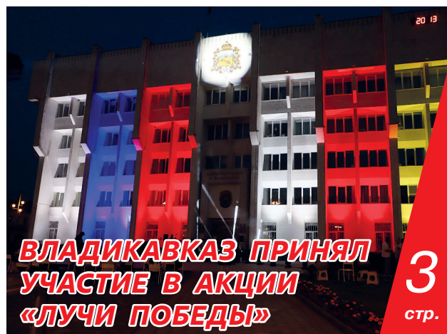
3 стр. ВЛАДИКАВКАЗ ПРИНЯЛ УЧАСТИЕ В АКЦИИ «ЛУЧИ ПОБЕДЫ»