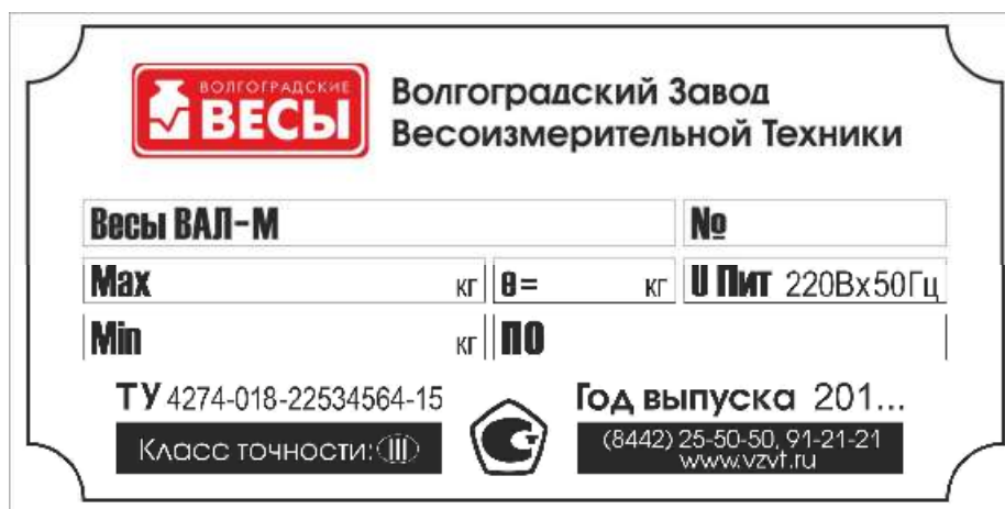
Рисунок 4 - Маркировка весов на грузоприемном устройстве