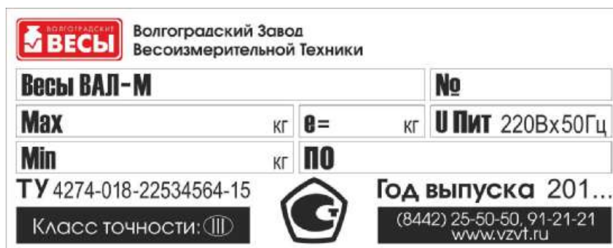
Рисунок 5 - Маркировка весов на индикаторе

Знак поверки в виде оттиска поверительного клейма ставится на пломбу, защищающую от изменения установленных регулировок.