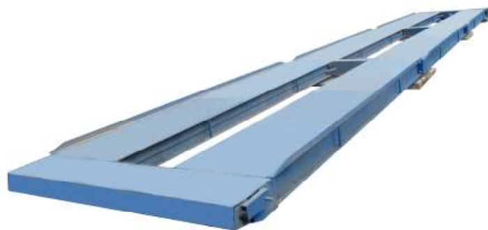
Рисунок 2 - Общий вид весов автомобильных ВАЛ-М

В весах предусмотрена защита от несанкционированного изменения установленных регулировок (установленных параметров и регулировки чувствительности (юстировки)) при помощи переключки, расположенной внутри корпуса индикатора.