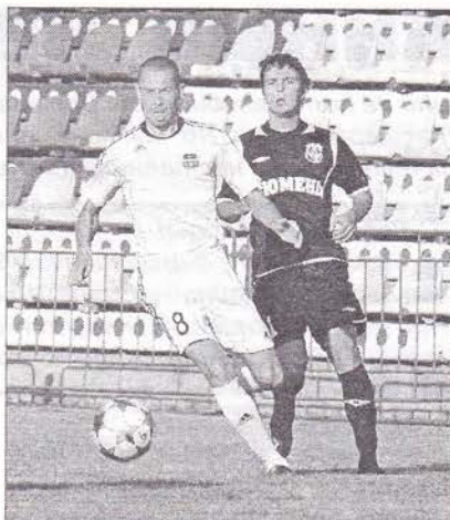
Представляем новобранцев команды