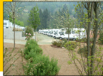
Come arrivare a Pollone