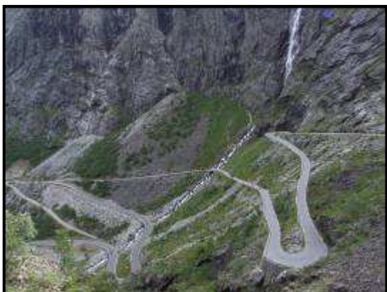
La strada dei Trolls