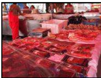
Il mercato del pesce