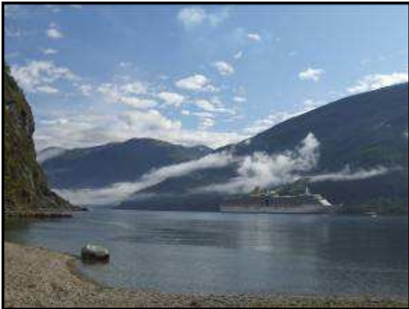
Una nave Costa Crociera

Così a malincuore abbiamo proseguito il viaggio. Abbiamo deviato sulla E16 per la 601 per comprare dei formaggi tipici in un piccolo paesino, Undredal. Qui si trova anche la più piccola stavkirke della Norvegia, con soli 40 posti.