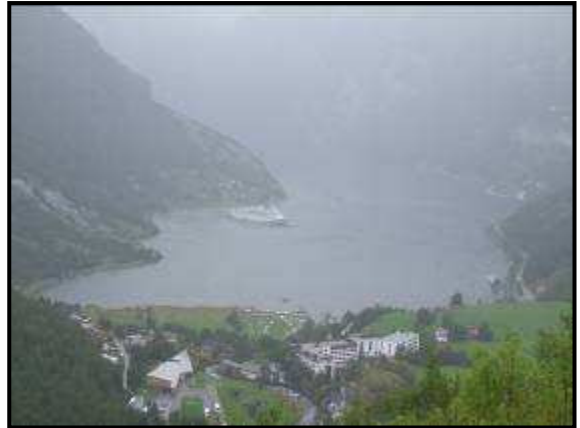
Il fiordo di Geiranger