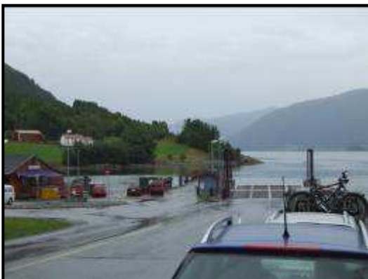
Solsnes: imbarco per Afarnes

Sostiamo nel parcheggio camper sul porto di Andalsnes insieme ad altri camper.