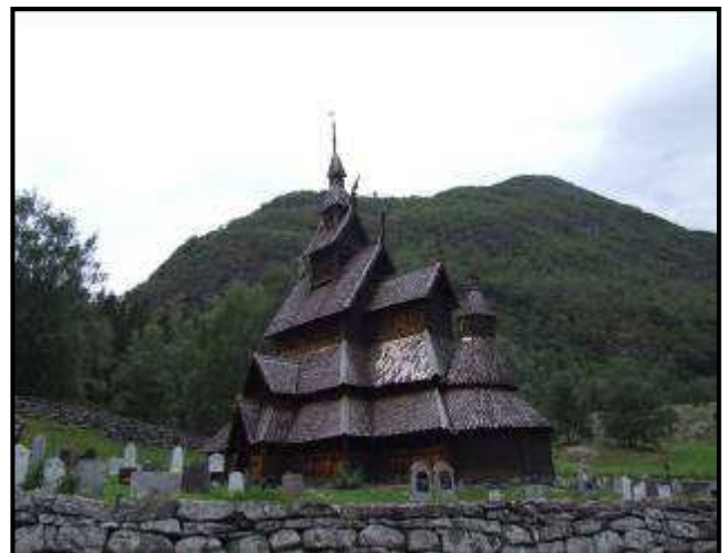
La stavkirke di Borgund