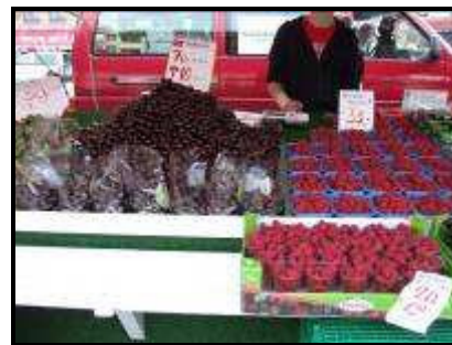
Il Mercato del pesce