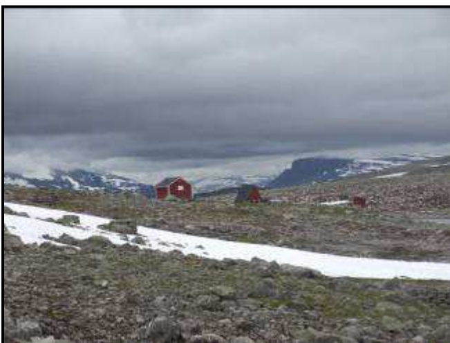
Panorama della strada antica

Dormiamo ad Aurland insieme con altri camper sul porto.