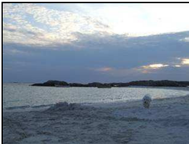
Sparky in esplorazione

Ci divertiamo con Sparky a scorrazzare sulla spiaggia per un'oretta, poi riprendiamo la 47 e poi la 39 in direzione Stavanger e arriviamo sull'Isola di Ognoy dove il paesaggio ricorda quello della Strada Atlantica. Troviamo un'area pic nic nascosta lungo la strada e ci fermiamo a dormire. Il paesaggio è bellissimo, siamo in pratica su un piccolo isolotto in mezzo al mare.