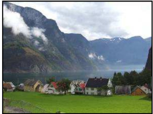
Il piccolo paese di Undredal

Riprendiamo la E16 fino a Voss. Lungo la strada ci sono dei bei torrenti e decidiamo di fermarci x pranzo in un'area pic nic.