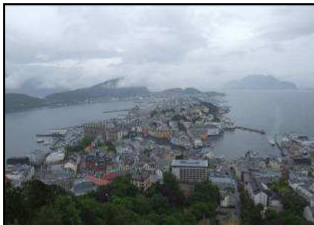
Vista di Alesund