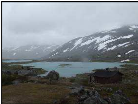
Panorama sulla strada 258

Riprendiamo poi la strada e giunti a Grotti deviamo lungo la 258 (su suggerimento dei sardi incontrati a Vallidal). Il primo km è in mezzo ad una vegetazione più che normale, ma subito dopo la veduta si trasforma in laghi azzurri e limpidissimi, prati, montagne innevate... semplicemente stupendo!!!