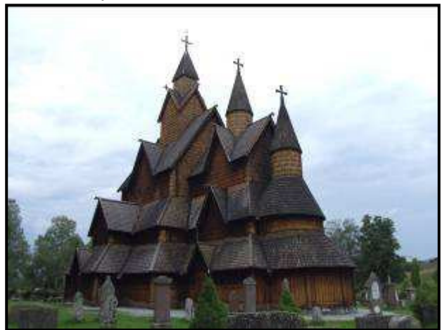
La stavkirke di Heddal

Data la sua posizione particolare, viene spesso chiamata "la cattedrale".