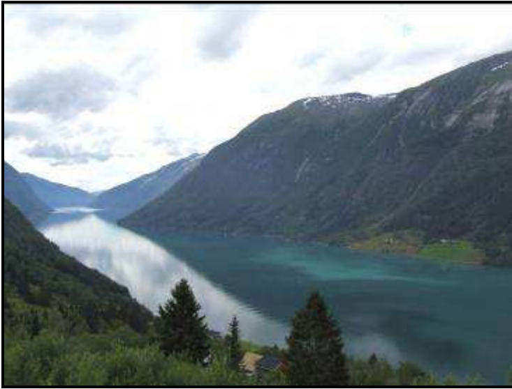
Il fiordo di Sogndal

Al mattino partiamo e salutiamo, dopo una chiacchierata di quasi un'ora, la simpatica signora spagnola e che ci chiede di inviarle la foto che abbiamo fatto insieme... che carina!!!