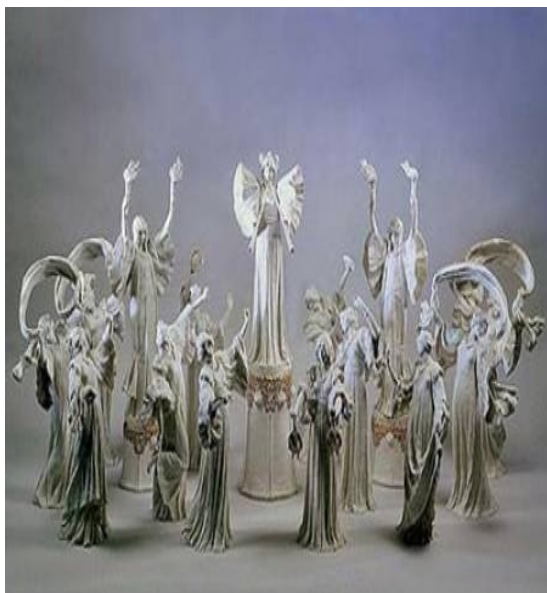
Agathon Léonard van Weydenfeld - La danse de l'écharpe - 1900 - décoration de tavola, porcellana di Sèvres - h. figure cm 40-50

Contiene ceramiche dal Medioevo al '700 ( 12.000 oggetti ) di ceramica islamica di Iznik, di ceramiche ispano-moresche, tutta la produzione italiana del Rinascimento ( Faenza, Firenze, Siena, Venezia ) e naturalmente una straordinaria collezione di ceramiche francesi da Nevers a Rouen, da quelle di Strasburgo a quelle di Marsiglia, la porcellana cinese e quella di Meissen ( tedesca ) e tutte le paste tenere francesi di Saint-Cluod, Chantilly, Vincennes, Sevres e Parigi .