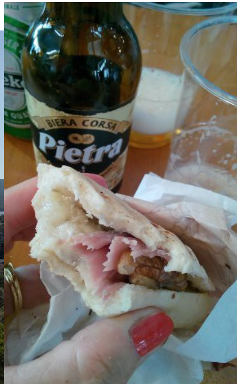
Porto Vecchio: La Birra locale

Nel tardo pomeriggio arrivo a Bonifacio – solito rito d’iniziazione, alla disperata ricerca del campeggio sul mare, dopo due dinieghi per il no post-camper, finalmente al termine di una strada difficoltosa per arrivare alla costa il campeggio “de siles”, anche questo distante dalla spiaggia oltre 1 km. Questa volta non ce la sentiamo di fare altri km a piedi e optiamo per un bagno in piscina.