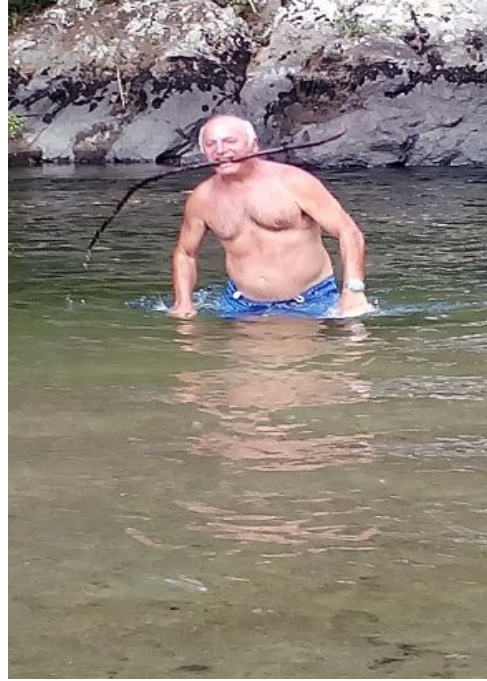
Bagno al Golo

Ritornati in campeggio, mi fermo a parlare con la padrona, del camping che nel frattempo puliva i fagiolini del suo orto, le chiedo: perché voi Corsi siete così restii a dare informazioni? Da stamane, appena arrivato, sono venuti due ciclisti e un'auto, hanno visto il vostro campeggio deserto e se ne sono andati, meno male che stasera qualche ospite in più si vede; a me pare, che voi stessi non invogliate molto i campeggiatori, il vostro camping (tranne il traliccio) è in una posizione ideale almeno in estate (quando non c'è il rischio di esondazione). L'episodio che ho raccontato è forse la sintesi di tutto il viaggio in Corsica, una regione ricca di mare, monti e fiumi, aspra e dolce nello stesso tempo come il carattere, chiuso e fiero dei suoi abitanti, una più socievole predisposizione, renderebbe tutto più facile e piacevole il soggiorno su quest'isola. Dopo questo scambio d'impressioni, chiedo se è possibile cenare in quel che sembra un ristorante dismesso, la signora felice ci prepara una bistecca di maiale ciascuno, patate lesse, e fagiolini, più un antipasto di salame e olive con del vino rosso, e uva. All'indomani vogliamo tornare indietro per visitare meglio l'aspetto naturalistico di questa Corsica "difficile".