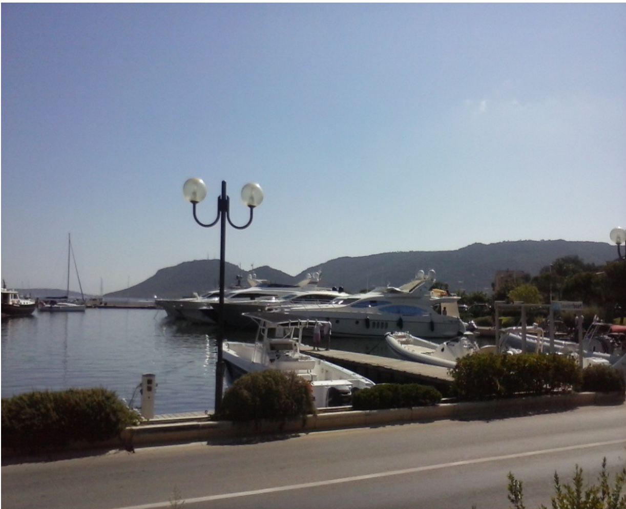
Porto vecchio: IL Porto

Lasciato "Pezza Cardo" - ci riferiamo al parcheggio "Casinò", seguiamo a piedi per il porto (il ritorno lo faremo con il taxi, 10euro per 2/3 km circa- mancano i mezzi pubblici e per noleggiare una piccola utilitaria ci hanno chiesto 95euro il giorno, mi sembra un po' troppo). Nella mattinata visita della città vecchia che si trova nella parte alta del paese, caratteristica per le sue vecchie case lasciate intatte nel tempo che ne fanno un borgo molto particolare; per raggiungerlo prendiamo il trenino 7,60 euro in due sole andate, ci aspettano negozietti ben forniti, Il Duomo, i Due Bastioni. All'orario di pranzo entriamo in uno dei ristoranti caratteristici per mangiare qualcosa, abbiamo intenzione di continuare nel pomeriggio per Bonifacio che dista altri 30km. (due baghette ripiene...., patatine e due birre locali più una henikem 25 euro)anche qui la sorpresa, la loro birra locale Petra se la fanno pagare 4 euro bottiglietta 25cc. Porto Vecchio: dista circa 140 km da Bastia, è un borgo di mare frequentatissimo, pieno di negozietti e ristoranti caratteristici. La zona alta detta la cittadelle, è opera dei genovesi, trovasi il bastione di San Giorgio e quel du-palais, si fatica un po' per visitarla ma aiuta molto un trenino che dal porto ti porta su.