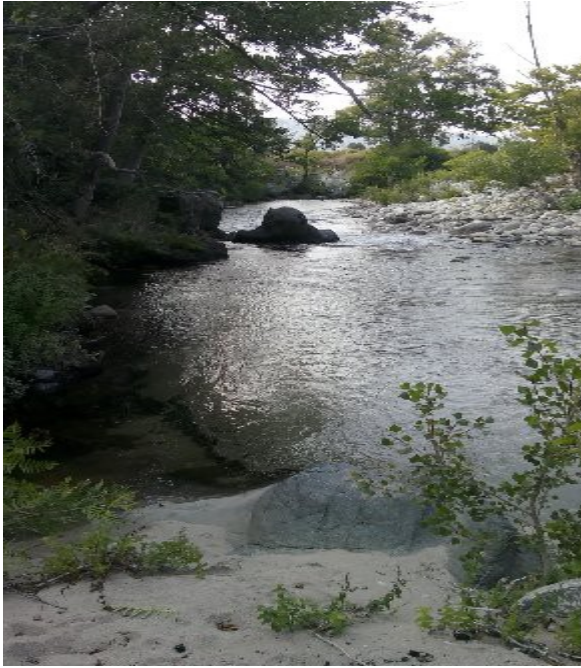
FIUME Golo ridosso al Camping