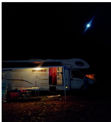
campeggio “Europa Beach” 24 euro giorno.