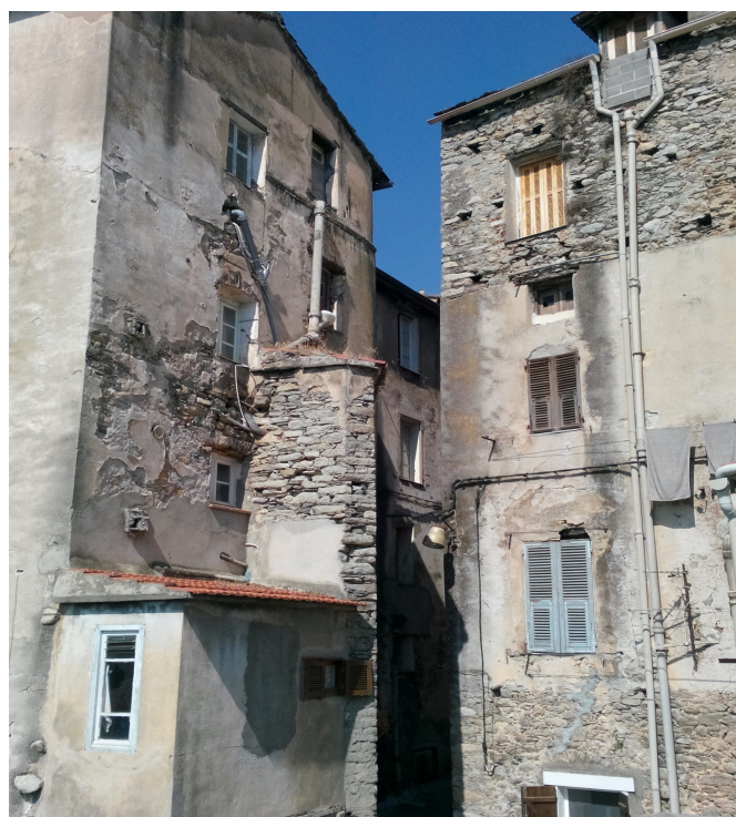
CORTE : Cittadelle- Con il Castello ,le fortificazioni