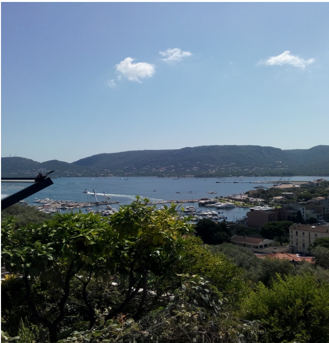
Porto-Vecchio: il Panorama