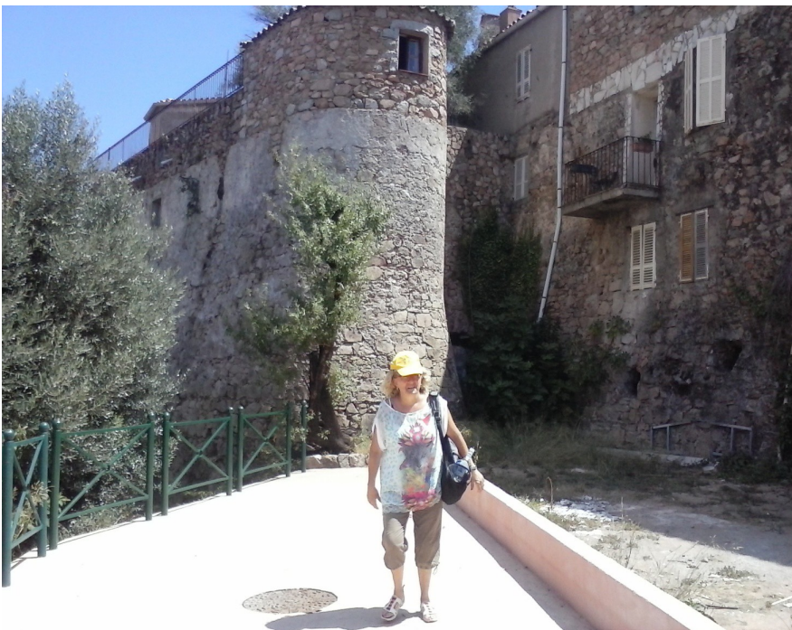
Porto Vecchio: Cittadelle