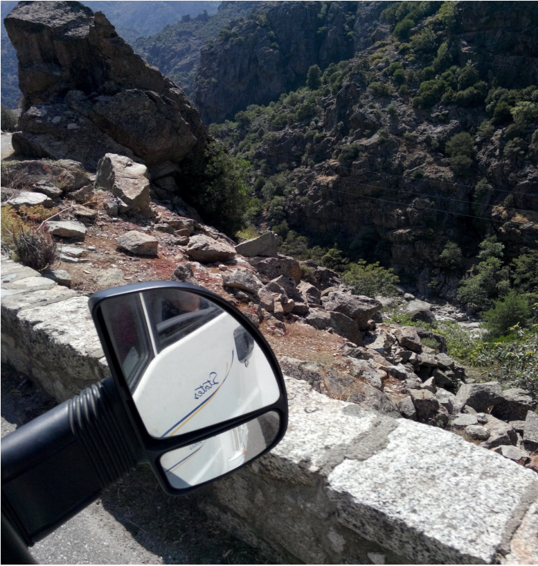
CALACUCCIA: la strada D84