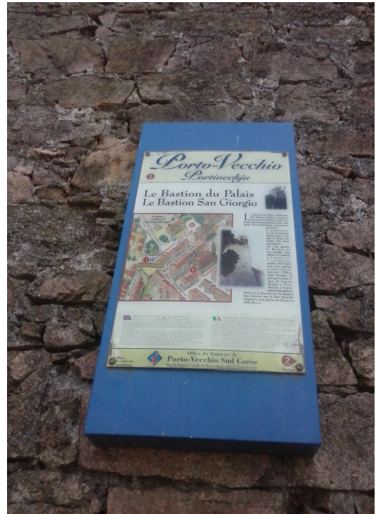
Porto Vecchio: Mappa della cittadelle