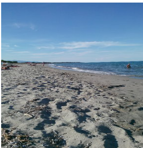
Spiaggia di Querciolo

Navigazione ottima, mare calmo, arrivo puntuale ore 12.00- Uscita Bastia-Direzione sud , dopo circa 35 Km in località Querciolo troviamo l'indicazione camping, si gira per una stradina secondaria, poi altri tre km. verso il mare troviamo posto nel camping Europa Beach gestito da una coppia di Corsi; Lui parla bene l'italiano e la prima cosa che ci chiede : quanti giorni rimarrete? Sapete! Questo camping è frequentato quasi elusivamente da Italiani che ogni anno ritornano perché innamorati del posto. Per noi, nulla di eccezionale, il camping molto spartano è un'ex caserma della legione straniera ha servizi che lasciano qualche dubbio, docce fredde, bagni unisex manca il market e non offre altro che la sua spiaggia. La nostra prima giornata passa con il primo Bagno in Corsica, e la cena in camper per pianificare il viaggio.