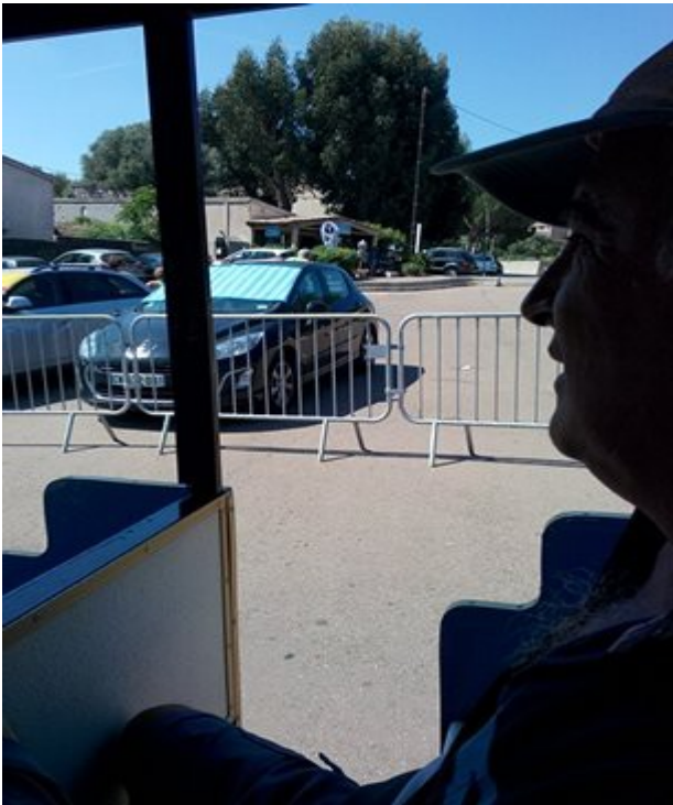
Porto Vecchio: il trenino