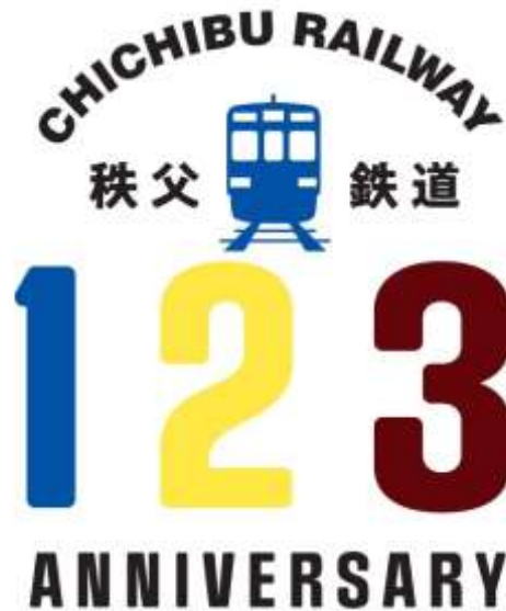
秩父鉄道創立123周年ロゴ イメージ

創立123周年にちなみ、「1」「2」「3」の数字に当社に関する色を添え、中心の電車とレールは当社と沿線地域が共に手を取り合って未来へ広がることを表現しております。現在、当社で活躍する電気機関車かつコーポレートカラーの青色、かつて黄色と茶色の電車が活躍していたことから、「青」「黄」「茶」の3色を基調としたロゴにいたしました。