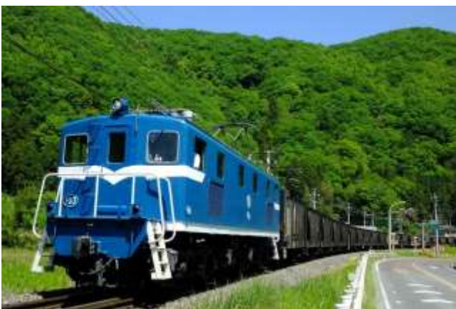
電気機関車 イメージ