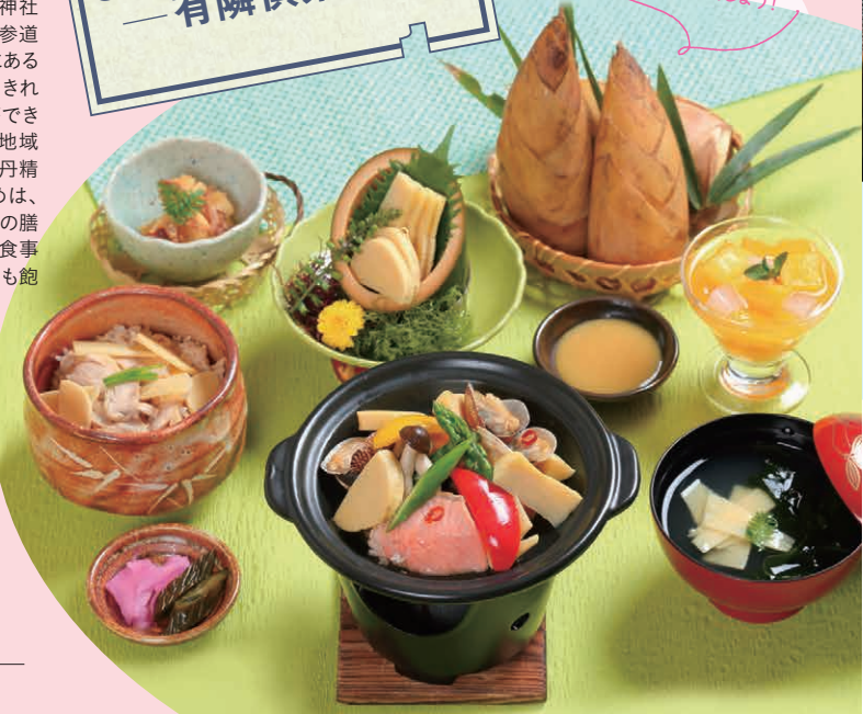
旬の膳 かくや姫イメージ