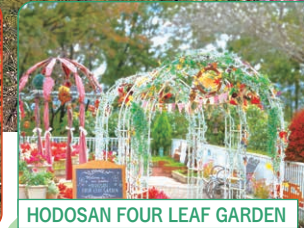
HODOSAN FOUR LEAF GARDEN