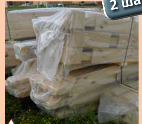
Доставленные на участок элементы домокомплекта, упакованные в прочный полиэтилен и стянутые полипропиленовой лентой