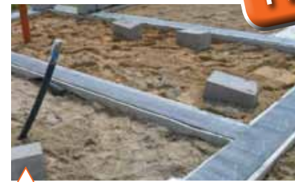
Горизонтальная гидроизоляция по обрезу фундамента