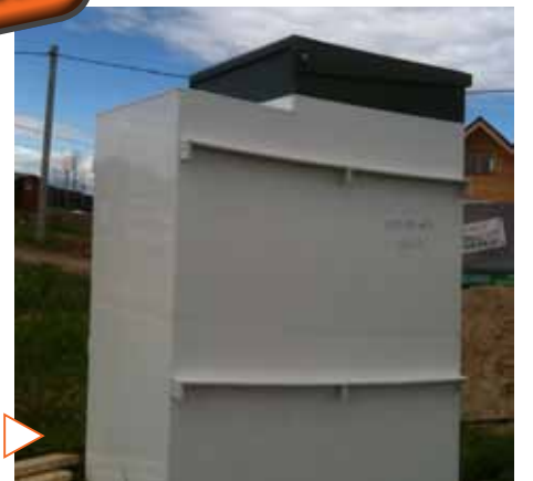
Очистная установка «ТОПАС 8» перед монтажом в грунт

опорной конструкции. Под дом был подведен мелкозаглубленный монолитный ленточный фундамент, что позволило значительно сэкономить