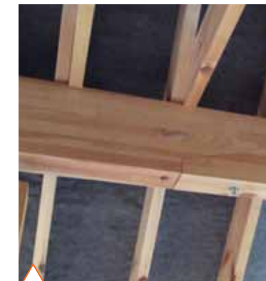
Стык составного прогона (продольной слеги)

Все детали стропильной конструкции изготавливаются по проекту и ВХОДЯТ В СОСТАВ ДОМОКОМПЛЕКТА