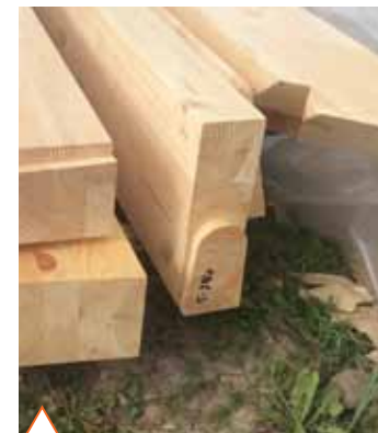
Распакованные элементы стропильной группы

Стропильная конструкция скатной крыши базируется на длинномерных элементах (прогонах, слегах), благодаря которым мансардный этаж не загроможден стойками и другими подпорными элементами. В частности, главный прогон имеет длину 11 метров. Его собирали из двух частей (отправочных единиц) непосредственно на стройплощадке, а потом устанавливали в проектное положение с помощью стрелового крана. Для стыковки половинок прогона был использован узел Гербера (шарнир Гербера). Устройство такого узла требует особой тщательности и аккуратности. Задача упрощается благодаря станочному исполнению концевых врубок. Стык стянули болтами из высокопрочной нержавеющей стали. Он практически незаметен, тем более на довольно большой высоте.