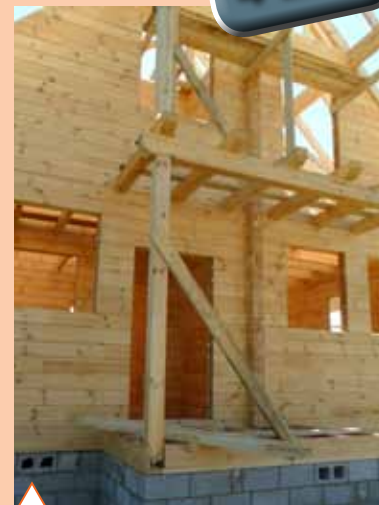
Сооружение балкона и открытой террасы (она же крыльцо у главного входа)

Междуэтажные перекрытия имеют балочную конструкцию. Балки врезаны в стены без применения дополнительных металлических опорных деталей. А вот стойки оснащены специальными устройствами – компенсационными винтами (домкратами). Они предназначены для урегулирования усадочного процесса. По мере усадки стен винт закручивают и тем самым уменьшают высоту вертикального элемента (деревянные столбы практически не подвержены усадочной деформации). С этой же целью в торцах оконных и дверных проемов вырезаны пазы. В них вставляют скользящие обсадные коробки («обсаду», «окосячку»), в которые, в свою очередь, вставляют окна и двери. Благодаря этому приему жесткие оконные и дверные рамы не подвергаются давлению вышерасположенных оседающих венцов.