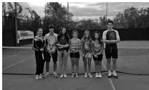
Corso di tennis per bambini.