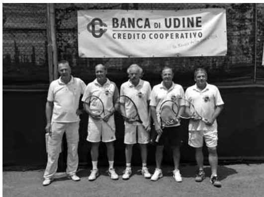
Roma, over 60 maschile, quarti classificati nazionali.