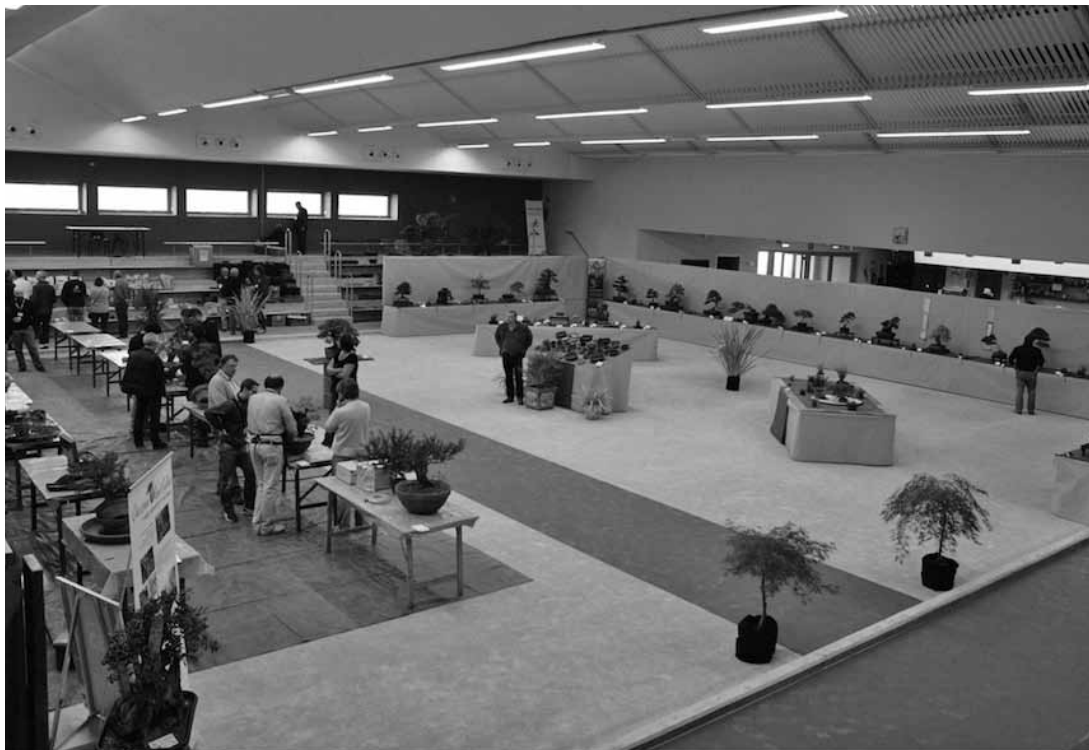
19-20 ottobre 2013: "Foglie d'autunno" al Bocciodromo di Cussignacco.