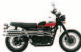
Triumph Scrambler Ano: 2010