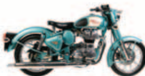
Royal Enfield Bullet Viajante: Gonçalo Luz Destino: Índia