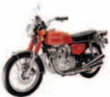
Honda CB Four 350 Ano: 1979 Viajante: Carlos Cordeiro