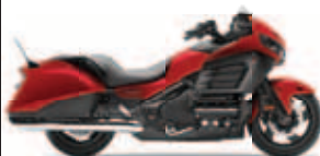
Honda GL1800 F6B Ano: 2013