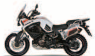
Yamaha Super Teneré World Crosser Ano: 2013