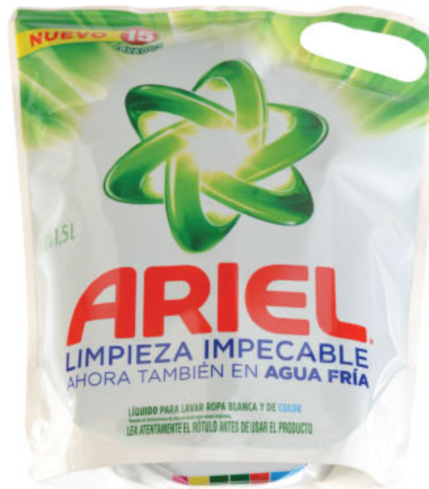
DETERGENTE ARIEL Pouch • x 1,4 lt x lt: $ 85,56 (1) CÔD. 1196923