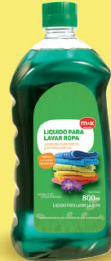
m&k DETERGENTE x 800 ml x lt: $ 56,24 (1) CÔD. 459160