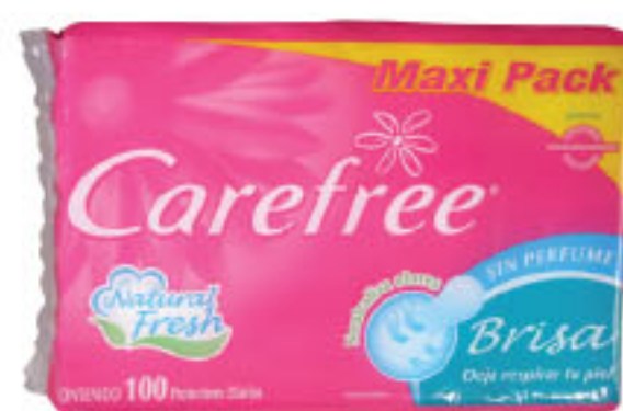
PROTECTORES CAREFREE Sin perfume • x 100 u • x u: $ 2,34 (1) CÔD. 125164