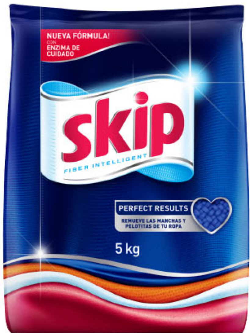
DETERGENTE SKIP Baja espuma • x 5 kg x kg: $ 86,88 (1) CÔD. 1066260