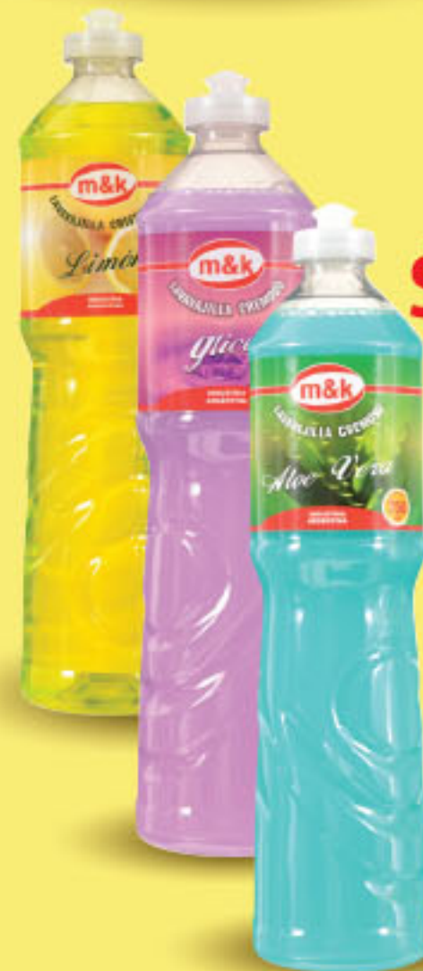
m&k LAVAVAJILLA Variedad x 750 ml x lt: $ 23,99 (1) CÔD. 486096 / 486135 / 486148