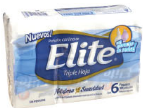
PAÑUELOS ELITE Extra seda • Pocket • 6 paq x 10 u • x u: $ 3,99 (1) CÔD. 539019