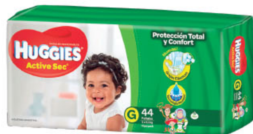
PAÑALES HUGGIES Active sec • M x 52 / G x 44 / Xg x 36 / XXG x 34 u • x u: $ 9,64 (1) CÔD. 1135602 / 1135589 / 1135615