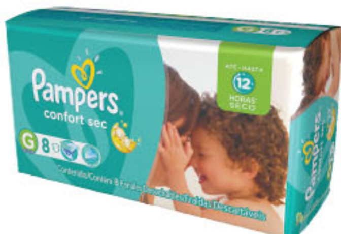
PAÑALES PAMPERS Confort sec • P / M / G / XG / XXG • x 8 u • x u: $ 7,87 (1) CÔD. 1042262 / 1042249 / 1042210