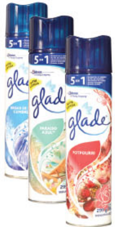
DESODORANTE GLADE Variedad • x 360 ml x lt: $ 117,64 (1) CÔD. 206713 / 1091558 / 1091584