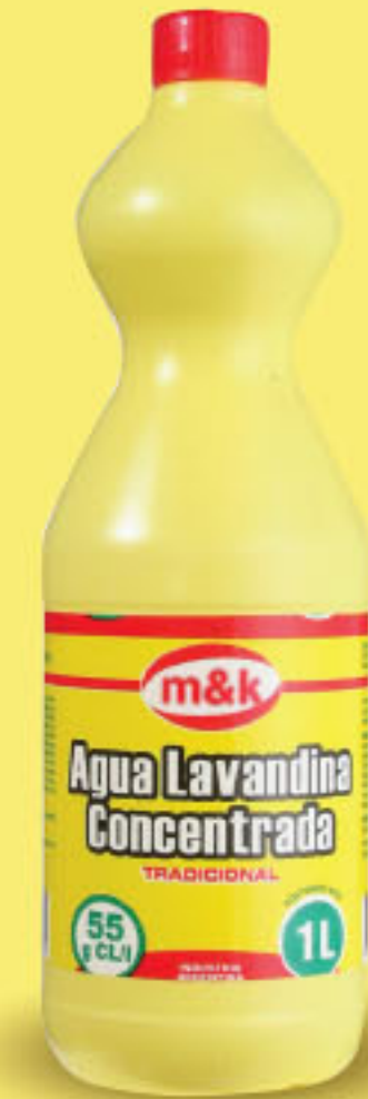
m&k LAVANDINA x 1 lt (1) CÔD. 486122