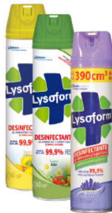
DESINFECTANTE LYSOL Variedad • x 360 ml x lt: $ 174,78 (1) CÔD. 940017 / 368199 / 551967