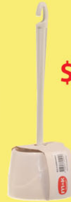
m&k BOLS SANITARIO (1) CÔD. 1171131