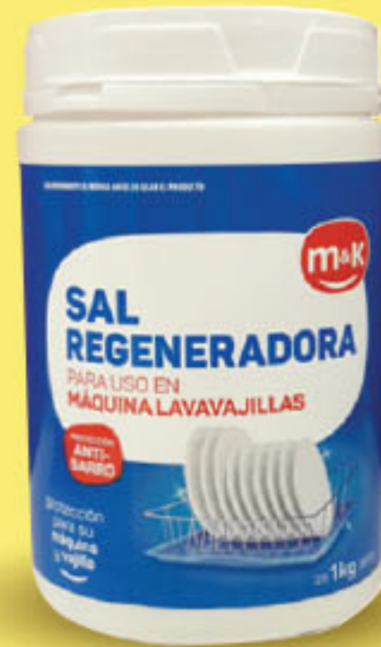
m&k SAL PARA LAVAVAJILLAS x 1 kg (1) CÔD. 1169571