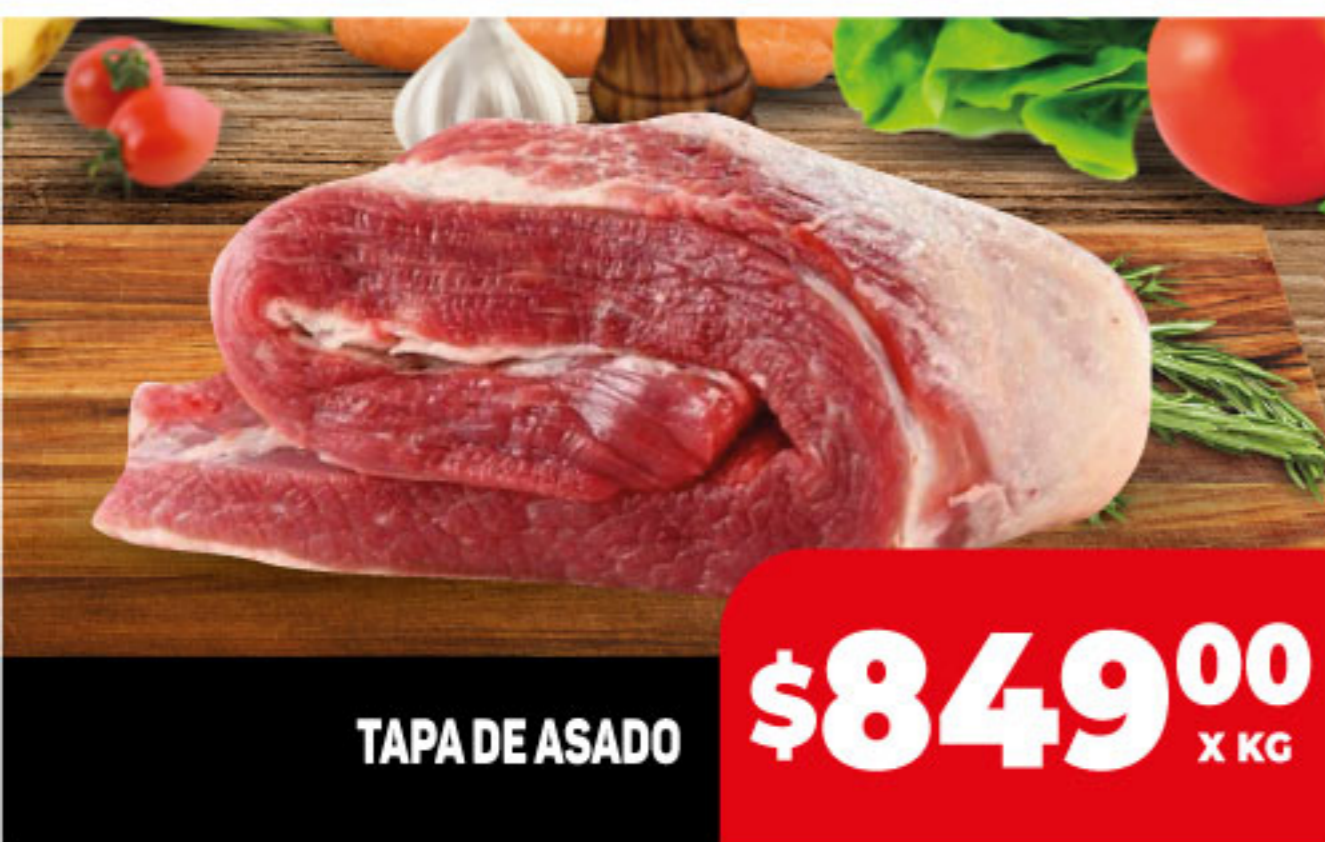
TAPA DE ASADO