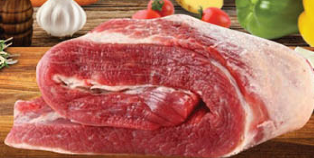
TAPA DE ASADO