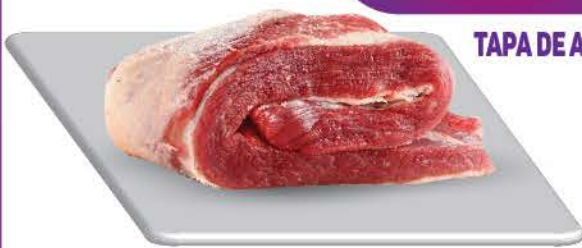
TAPA DE ASADO