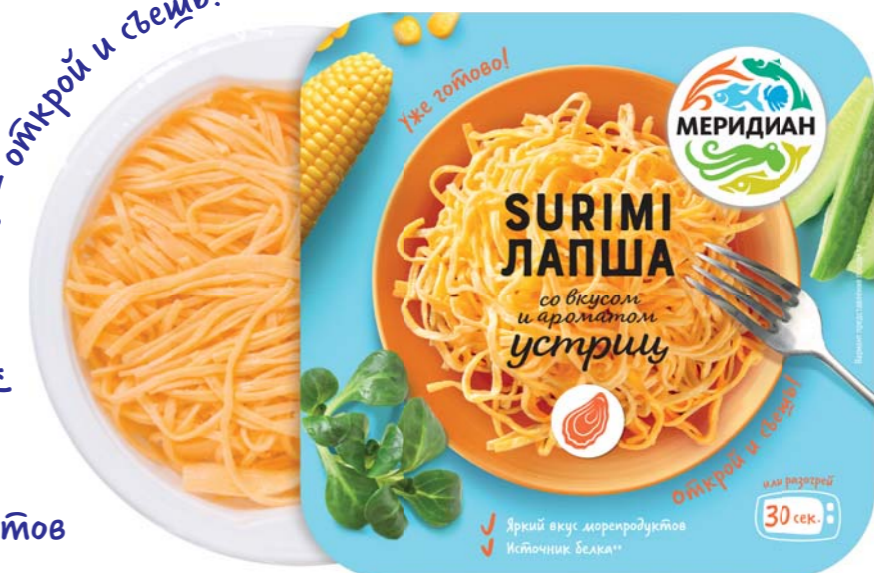
12 Яркий вкус морепродуктов