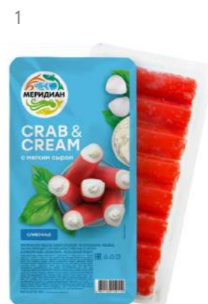
Крабовые палочки с мягким сыром Crab&Cream