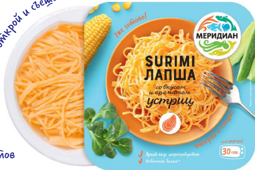
12 Яркий вкус морепродуктов