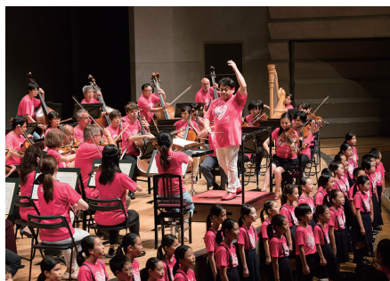
「あいうえオーケストラ」

最終日27日のコンサートは秋山和慶さん指揮、地元広島交響楽団とアフィニス祝祭管弦楽団の合同により、ブラームスの交響曲第2番他が演奏された。海外などからの招聘演奏家は17名、音楽祭には日本の24のオーケストラから、計48名が参加した。入場者も前々回、前回を大きく上回り、広島での最後の音楽祭は充実した音楽祭となった。