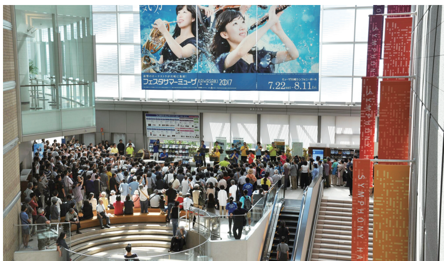
ホール入口でのオープニング・ファンファーレ

今年も「フェスタサマーミュージザ KAWASAKI 2017」が7月22日から8月11日までの期間開催された。ジョナサン・ノット指揮の東京交響楽団によるストラヴィンスキーの「春の祭典」でオープニングを飾り、最終日の秋山和慶指揮の東京交響楽団によるラフマニノフの交響曲第2番まで、首都圏10のプロフェッショナル・オーケストラによる13回のコンサート、これに金沢からオーケストラ・アンサンブル金沢、札幌からPMFオーケストラ、また地元川崎から昭和音楽大学、洗足学園大学の2つの音楽大学のオーケストラ、子供たちによる川崎ジュニア・オーケストラのコンサート、計18回のオーケストラによるコンサートが開催された。その他の公演、公開リハーサル、プライベートなども含む来場者数は34,000人となり、これまでの最高記録であった2016年を上回り過去最高となった。