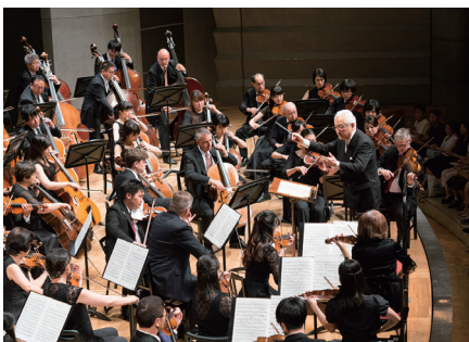
「合同オーケストラ演奏会」