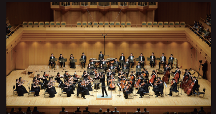
上海フィルのアンコールは中国人作曲家の劉天華さんの作品「良宵 (Beautiful Night)」

5日の上海フィルの演奏で開幕。1曲目は芥川也寸志さんの代表作、弦楽のための三楽章「トリプティーク」。2曲目は中国国務院から若手国際芸術家大使に任命されている秀英ジェ・ヤン氏が甘美な音色でショパンの協奏曲2番を熱演。休憩後のドヴォルザークの交響曲第8番は金管楽器の圧倒的な迫力と弦楽器の繊細な響きが絡み合った聴きごたえのある演奏が観客を魅了した。アンコールは中国の作曲家劉さんの幻想的な小品「良宵 (Beautiful Night)」が見事なデザートとなった。正にビューティフル・ナイトを醸し出した。