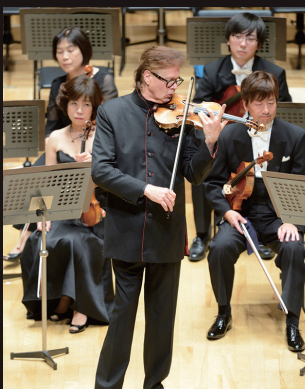
デュメイがラヴェル「ツィガーヌ」を熱演