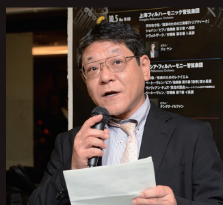
司会を務める文化庁小倉信宏主任芸術文化調査官