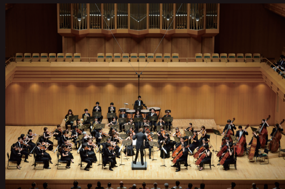
ビゼーを熱演、万来の客席を魅了した