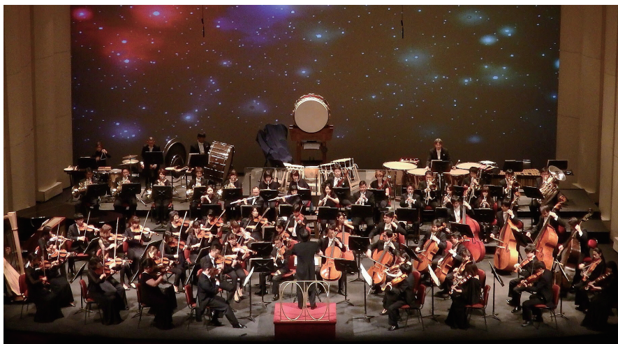
サンチアゴ市立劇場での演奏会

藝大フィルハーモニアは、昨年11月に名称を「藝大フィルハーモニア管弦楽団」と改称して生まれ変わり、今年4月「日本オーケストラ連盟」に準会員として加盟させていただきましたが、これを後押しするかのようになり、今回の南米チリ公演が実現いたしました。