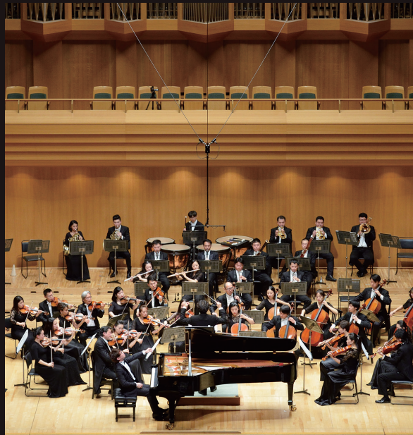
中国若手秀英ジェ・ヤンが奏でるショパンピアノ協奏曲第2番

5日の上海フィルの演奏で開幕。1曲目は芥川也寸志さんの代表作、弦楽のための三楽章「トリプティーク」。2曲目は中国国務院から若手国際芸術家大使に任命されている秀英ジェ・ヤン氏が甘美な音色でショパンの協奏曲2番を熱演。休憩後のドヴォルザークの交響曲第8番は金管楽器の圧倒的な迫力と弦楽器の繊細な響きが絡み合った聴きごたえのある演奏が観客を魅了した。アンコールは中国の作曲家劉さんの幻想的な小品「良宵 (Beautiful Night)」が見事なデザートとなった。正にビューティフル・ナイトを醸し出した。