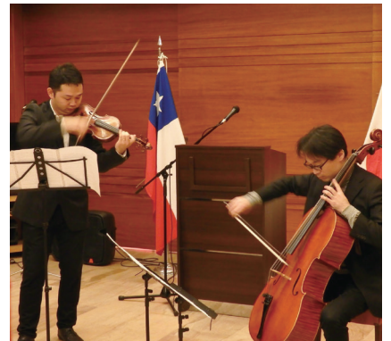
在サンチアゴ日本大使館での演奏

チリ公演を終えて、どの会場でも熱烈な拍手とスタンディングオベーションを受け、オー