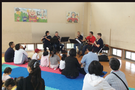
児童センターでマレーシアフィル木管五重奏のミニコンサート

マレーシアフィルのメンバー有志は前日に被災地のいわき市小名浜児童センター、いわき市こども元気センター(いわき市植田町)を訪問しアウトリーチを実施。公演当日の午前中にはホールのキッズ・ルームでお話とミニコンサートを実施。子供たちと交流を深め、大震災からの復興を祈念した。