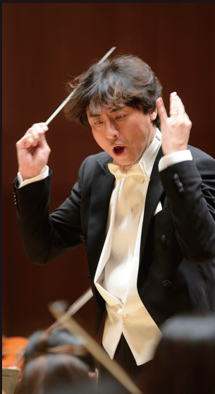
上海フィル首席指揮者、リャン・ツァンマエストロ渾身のドヴォルザーク交響曲第8番