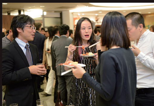
談笑する楽団員、和やかな交流風景