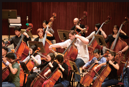
ブラームス交響曲第1番リハーサル風景 両楽団員が仲良く隣り合わせ