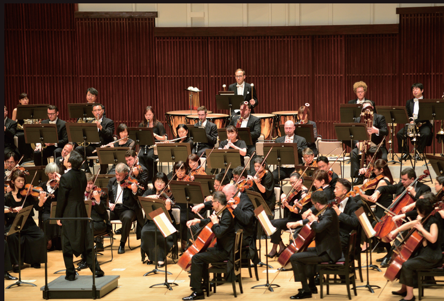
マレーシアフィル、関西フィル合同でブラームス交響曲第1番を熱演

8日は東日本大震災の復興支援を祈念する、被災三県で行っている招聘オーケストラ(今回はマレーシアフィル)とホストオーケストラの合同演奏会を福島県いわき市で実施した。