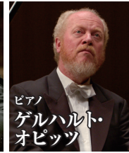
ピアノ ゲルハルト・オピッツ