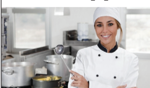
График: 2/2. Район работы: ж/д Тел.: 370-08-05

назови кодовое слово "УСПЕХ" и получи 1000 руб. к первой з/п В СВЯЗИ С РАСШИРЕНИЕМ ПРИГЛАШАЕМ МЕНЕДЖЕРОВ ПО ПРОДАЖАМ В САЛОНЫ И СЕКЦИИ СОТОВОЙ СВЯЗИ 8-932-470-77-55 заработная плата от 25 000 руб.