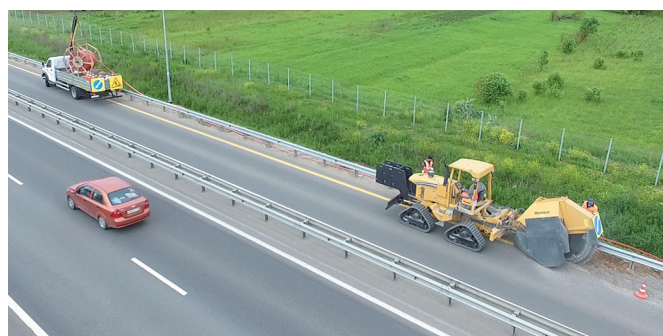
Рис.1. Строительство микрокабельной канализации на федеральной трассе М-3 "Украина"

Проект нацелен на создание умных автодорожных телекоммуникационных сетей – прокладку транспортной многоканальной коммуникации