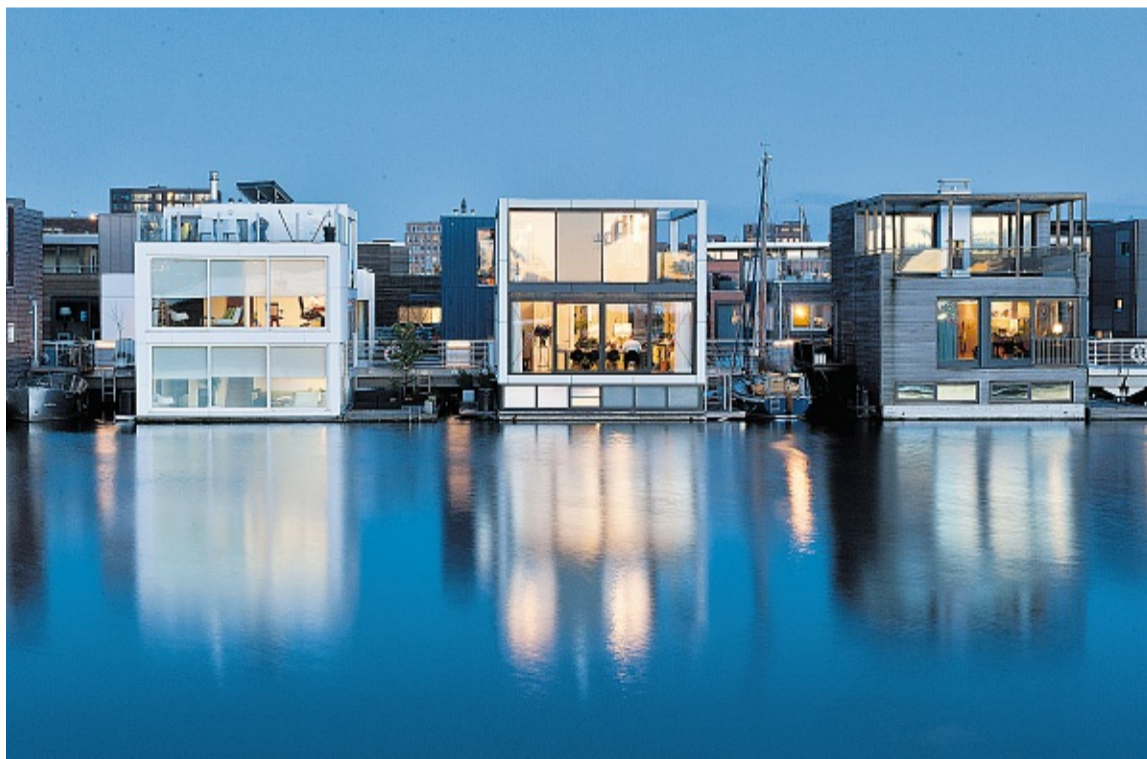
Watervilla IJburg Plot I3, à Amsterdam, habitations réalisées en 2010 par l'agence Waterstudio. ARCHITECT KOEN OLTHUIS, WATERSTUDIO