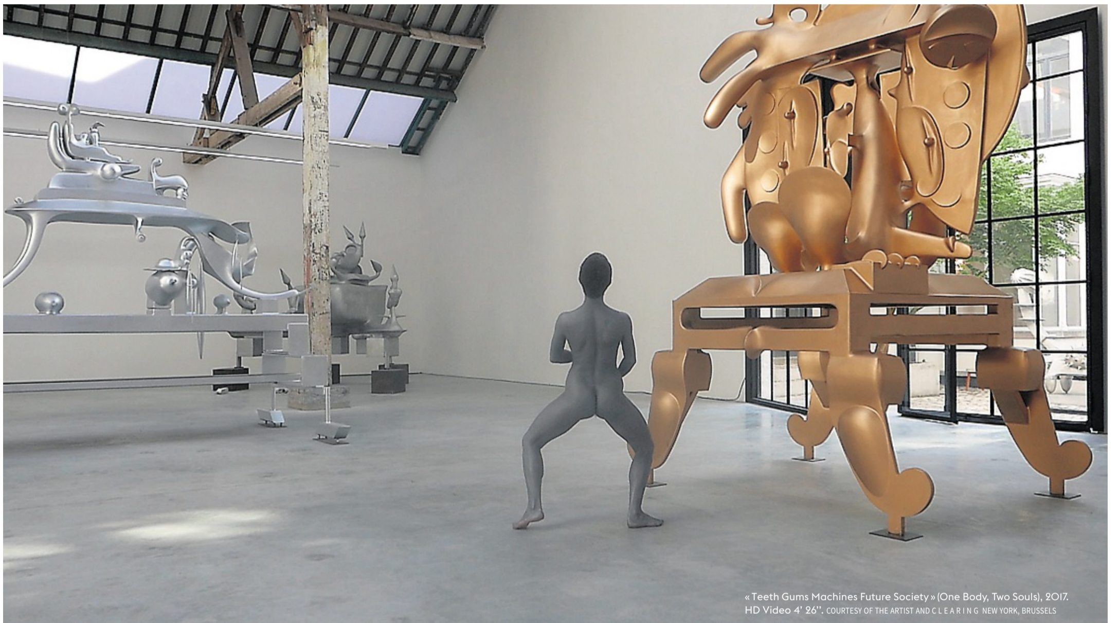
« Teeth Gums Machines Future Society » (One Body, Two Souls), 2017. HD Video 4' 26".

ESQUISSES DU FUTUR 3|6 Les artistes contemporains explorent l'avenir à la lumière des sciences sociales. Cette semaine, l'incarnation des discriminations de « race », de genre ou de classe par une plasticienne-performatrice