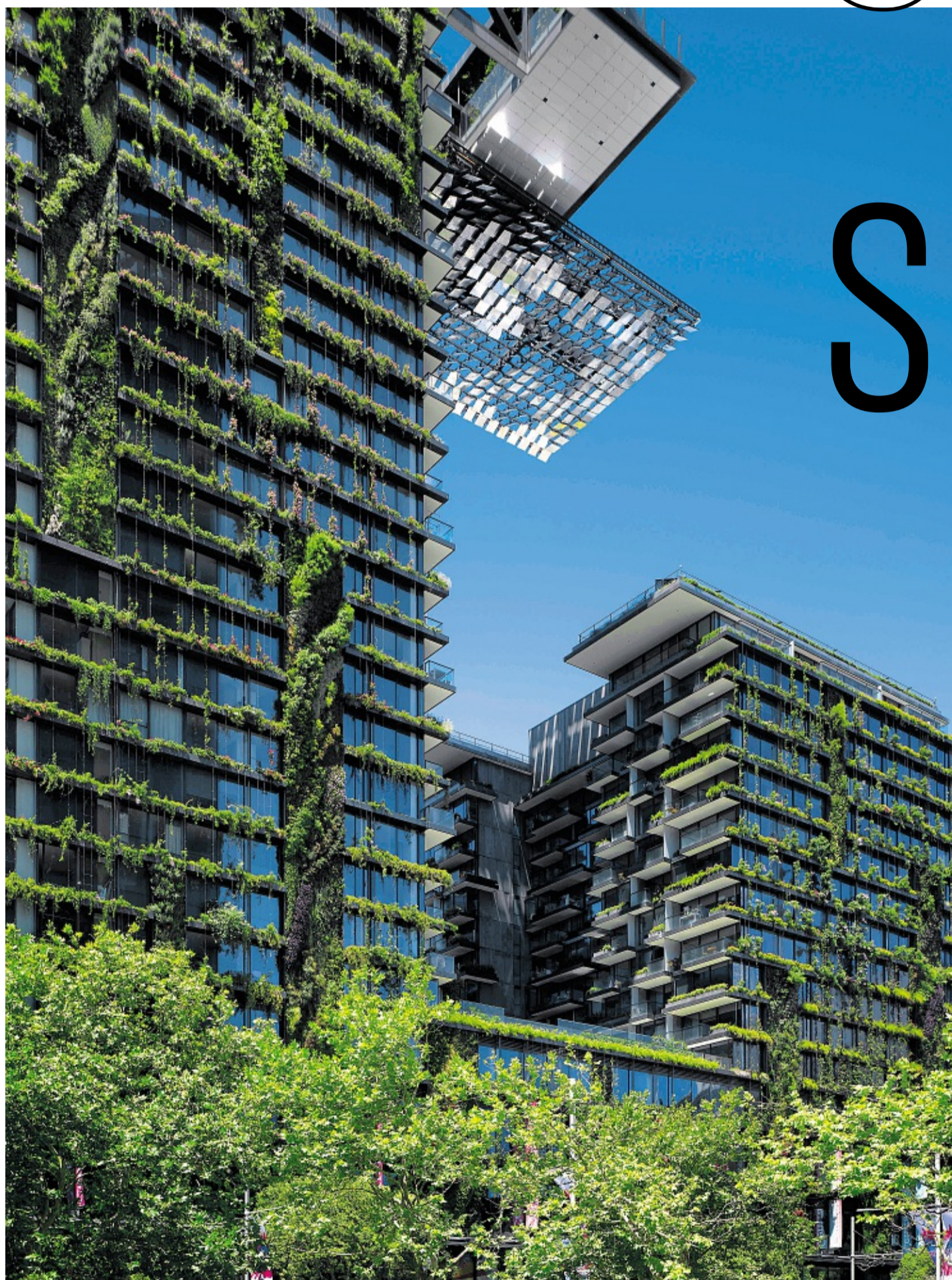
Le complexe One Central Park, de Jean Nouvel, à Sydney, en Australie, accueille un jardin vertical conçu par le botaniste Patrick Blanc. ARCHITECTE CONCEPTION ATELIERS JEAN NOUVEL - ARCHITECTE D'EXÉCUTION PTW ARCHITECTS.

L'état d'urgence est décrété : d'ici à 2050, les deux tiers de la population vivront dans les grandes villes, déjà au bord de l'asphyxie. Habiter sur les mers, aménager les zones désertiques ou faire respirer les zones urbaines, les projets des nouveaux « architectes verts » portent une vision ambitieuse : créer une nouvelle civilisation, en symbiose avec son environnement