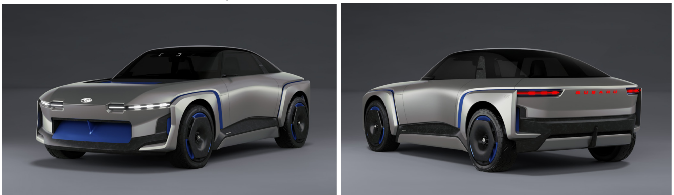
SUBARU SPORT MOBILITY Concept

電動化時代も、日常から非日常まで意のままに運転し、いつでもどこへでも自由に走って行ける愉しさを表現。安心できるからこそ、ワクワクするような新しい挑戦ができる。SUBARU SPORT 価値の進化を予感させる BEV *1 のコンセプトモデルです。ドライバーを中心に、四輪を意のままにコントロールするイメージを基本骨格とし、低く座りながらも視界と見切りの良さを確保する事で、安心して走りを楽しめるパッケージングを実現。外装にあたるボディパネルは面数やキャラクターラインを極力少なくし、張りのあるクリーンな立体でプロテクション感と空気の流れを感じさせる造形としています。