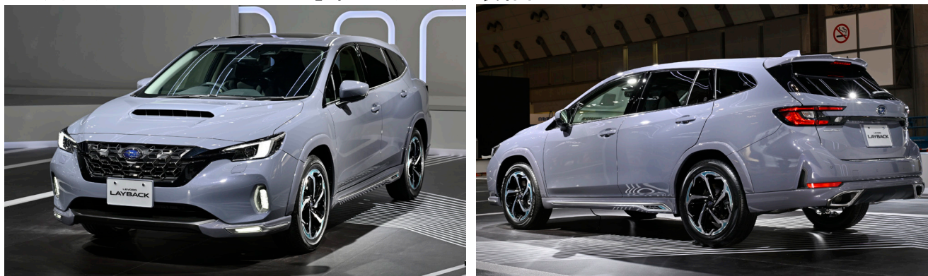
レヴォーグ レイバック「Limited EX」純正アクセサリ装着車

クラディング部をボディカラーと同色のパーツでコーディネートする「プレミアムアーバンパッケージ」をベースとし、お客様の個性を演出する用品と組み合わせることで、上質かつ洗練されたスタイルを表現したレヴォーグ レイバックの SUBARU 純正アクセサリ装着車です。