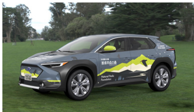
那須平成の森の活動に使用される車両 (ソルテラ、イメージ)

SUBARU は、航空機メーカーの DNA を持ち「人を中心としたモノづくり」のなかで安全を最優先に考え、「いのちを守る」ことを大切にしてきました。その想いを軸に、お客様・販売店・SUBARU、そして地域社会と共に行う活動として、「一つのいのちプロジェクト」に取り組んでいきます。かけがえのない「ひとのいのち」、大切にしたい豊かな森の植物や生き物といった「自然のいのち」、この2つのプロジェクトテーマを掲げ、我々と同様の想いをもち「笑顔のあふれる未来に向けて守り・繋いでいく」ために日々活動している方々を応援していきます。