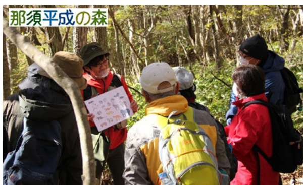
日光国立公園 那須平成の森 (インタープリター*4の活動風景)