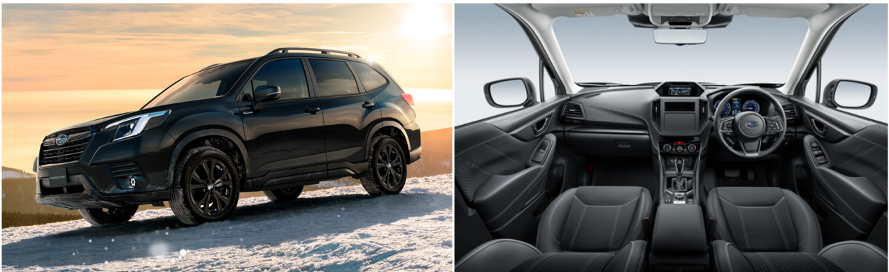
フォレスター 特別仕様車「X-EDITION」

「Touring」に、人気の高いアクセスキー対応運転席シートポジションメモリー機能や後席左右のシートヒーターなどに加え、撥水ファブリック/合成皮革シートや撥水カーゴフロアボードなど、普段使いでも、アウトドアシーンでも使い勝手の良いアイテムを標準装備し、お買い求めやすい価格設定とすることで、アウトドアにチャレンジするお客様の気持ちを後押しします。