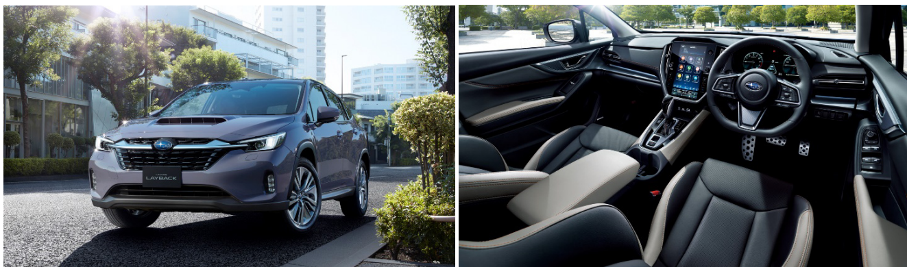
レヴォーグ レイバック「Limited EX」

レヴォーグ レイバックは、広角単眼カメラを搭載した新世代アイサイトを採用するとともに、ドライバーの運転負荷を軽減する高度運転支援システム「アイサイト X(エクス)」を標準装備しました。また、最低地上高 200mm 確保による SUV ならではの高い走破性と、スポーティな走りを両立させつつ、高い静粛性と快適な乗り心地を実現しました。さらに、存在感を放つスタイリッシュなエクステリアデザインと、空間を豊かに彩るインテリアが、乗るたびにドライバーへ「ゆとりとくつろぎ」をもたらします。