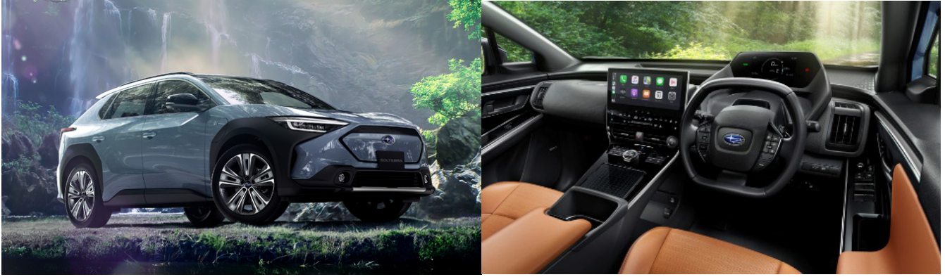
ソルテラ「ET-HS」改良モデル

SUBARU「ソルテラ」は、BEV ならではの新しい価値や、私たちが長年にわたって大切に培ってきた「安心と楽しさ」という SUBARU ならではの価値を詰め込むことで、地球環境に配慮しながらも、これまでの SUBARU のクルマと同様に安心して選んでもらえる実用性を持った SUBARU 初のグローバル BEV です。