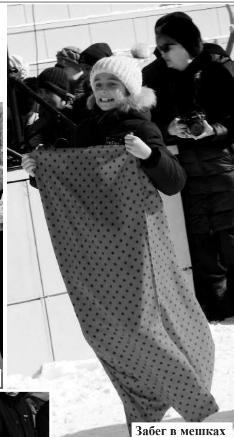
Забег в мешках