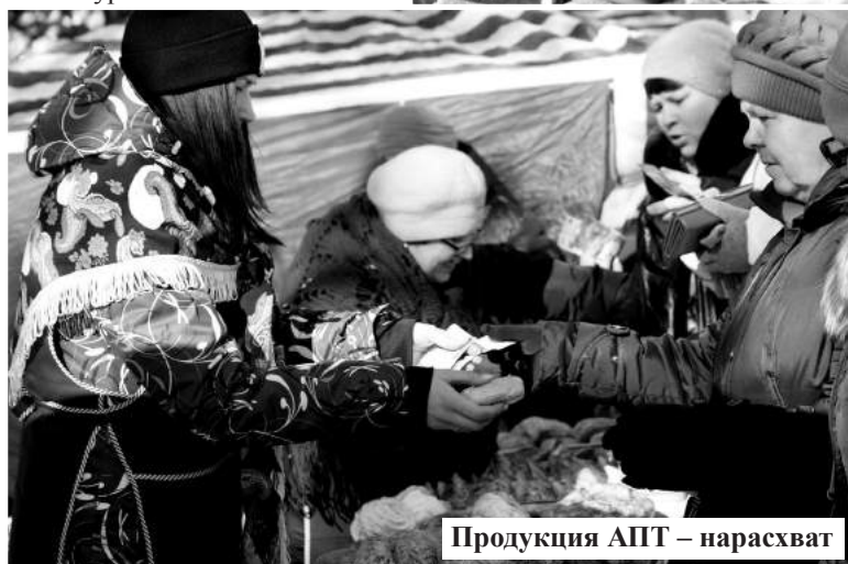
Продукция АПТ – нарасхват

Очень бойко идет торговля продукцией Амурского политехнического техникума. Я тоже невольно притормаживаю и «поедаю» глазами всевозможные вкусности. Если бы не работа, разве бы отошла от прилавка с пустыми руками! В надежде вернуться сюда, как только освобожусь, прошу рассказать, что же приготовили в учебном заведении для угощения амурчан.