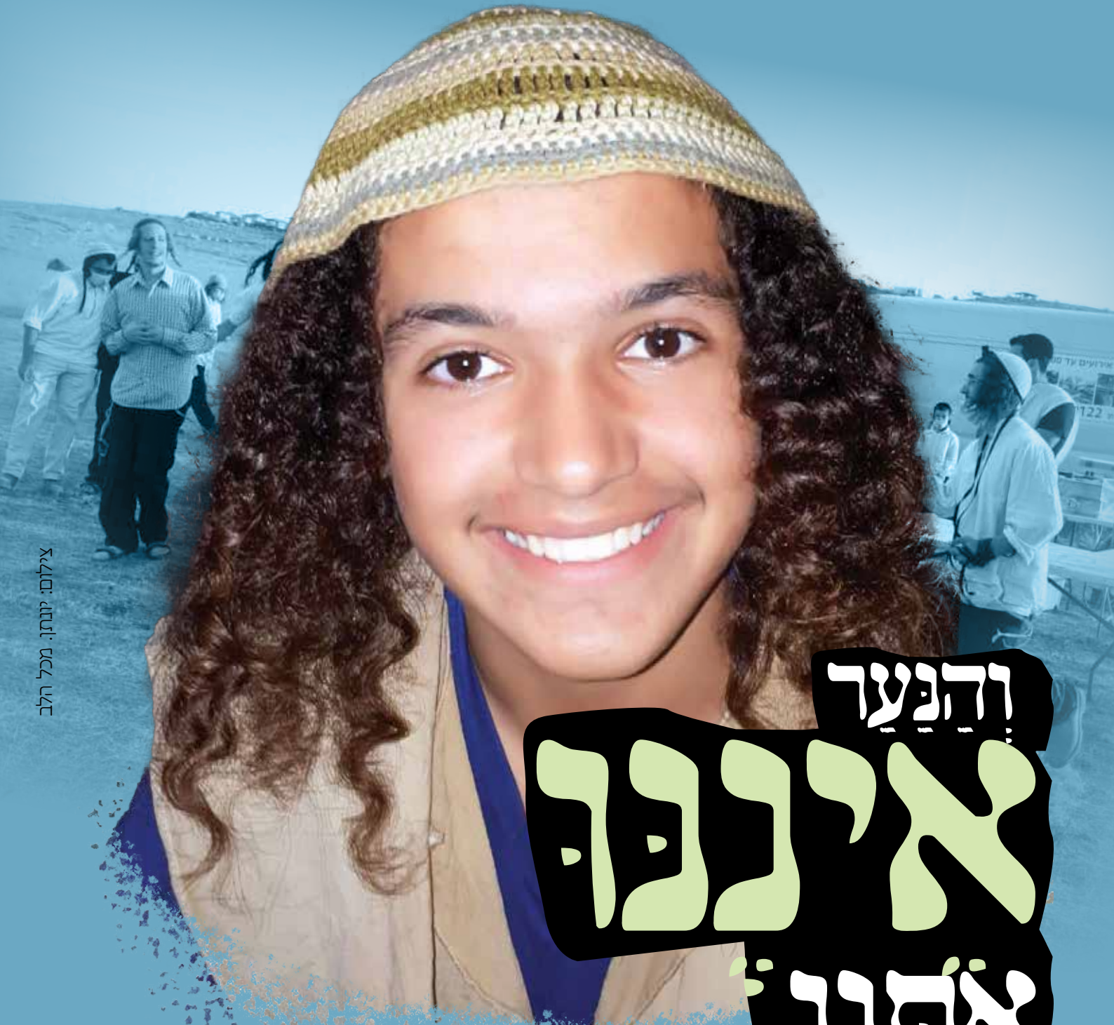
מכל הלב