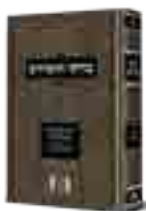
מתוך הספר בדורי החסידים חלק ב' שיראה אור בקרוב