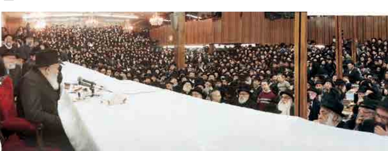
עשרות שנים של ביאורים ברשי" הרבי בהתוודות