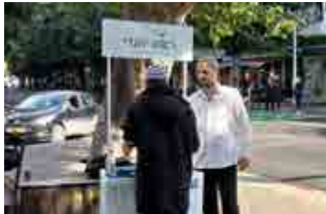
המטרה להגיע בסוף לחברות

לחץ עליו לקיים מצוות, עד שיום אחד הוא בא לרב ואמר לו "אני רוצה להניח תפילין", הוא תאר את מאור הפנים שהיה לרב וכמה שהוא התרגש מהבשורה החשובה הזו. כך היה הרב, מאוד יסודי, ובונה קומה שלמה של יהודי, שמתוך האמונה הוא יבוא לידי קיום המצוות. הוא האמין שזה מוכרח לבוא, האמונה תביא לקיום מצוות בוודאות.