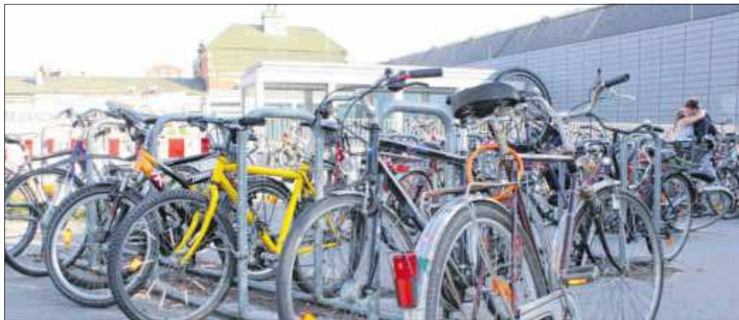
Rund 170 Drahtesel werden derzeit am Hauptbahnhof, Eingang Steinrader Weg geparkt. Ab dem heutigen Mittwoch wird der Platz komplett gesperrt.

Auf einige weitere Unwegsamkeiten müssen sich Radler in der kommenden Zeit einstellen. So wird die sogenannte „Kamelbrücke“ zwischen Buntekuh und St. Lorenz-Süd wegen des Baus einer neuen Fernwärmeleitung der Stadtwerke gesperrt. Fußgänger und Radfahrer werden durch Schilder darauf hingewiesen. Die Umleitungsstrecke über die Moislinger Allee ist etwa 2,7 Kilometer, die Umleitungsstrecke über die Ziegelstraße