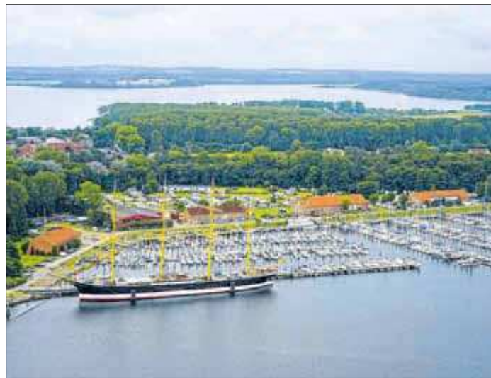
Um dieses Areal geht es bei dem Waterfront-Projekt.

Unterlagen können bis 22. August bei der Bauverwaltung eingesehen werden.