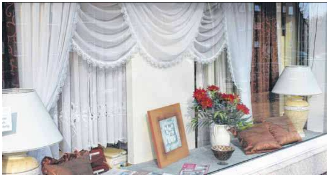
Einen ersten Eindruck der romantischen Fenstergestaltung liefern die Schaufenster von Gardinen-Schlichting in der Lübecker Ziegelstraße 34.

Weniger ist mehr: Alle Ideen wollen wohl dosiert sein. Manchmal ist weniger mehr. Da greift die Rundumberatung