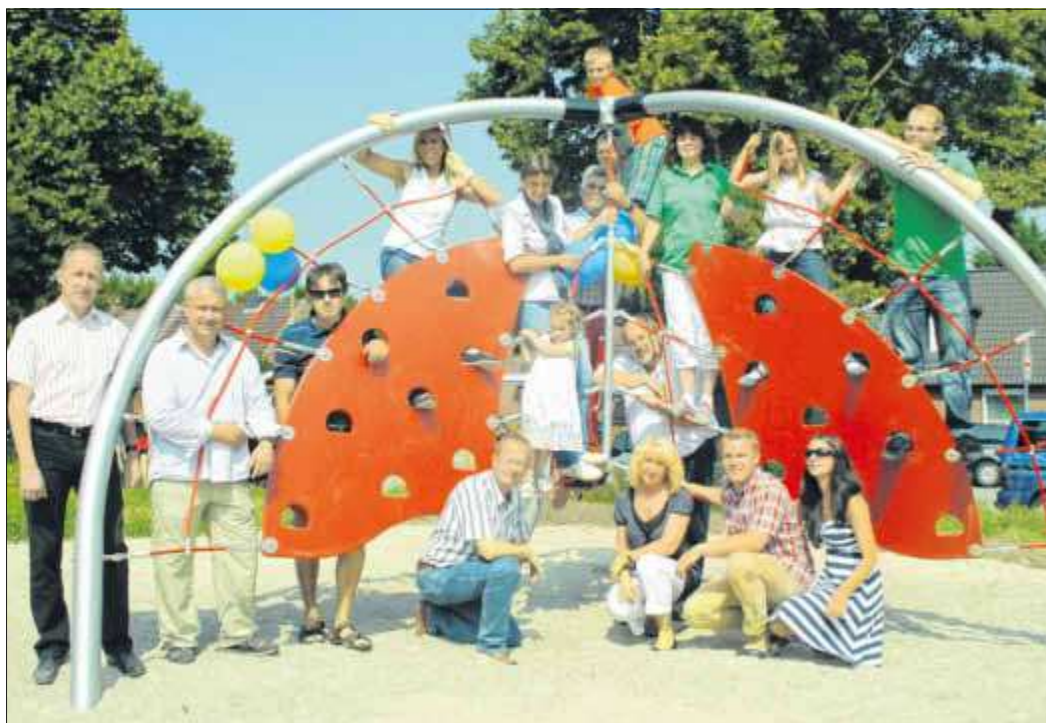
Gemeinsam in Bewegung: Organisatoren und Anwohner freuen sich über das Klettergerät „Trinity“

In Zusammenarbeit mit der Lübecker Uni und dem Bereich Stadtgrün und Verkehr und der Interessengemeinschaft Dornbreite wurde das