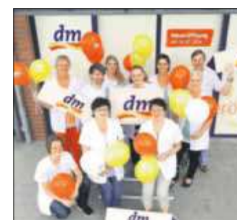
Das dm-Team freut sich auf die Eröffnung in Groß Grönu.

Am 24. und 25. Juli gibt es im dm-Markt ein „Gastspiel“ der besonderen Art. An verschiedenen Erlebnisstationen können Interessierte in neue Seh-, Hör-, Geschmacks-, Gefühls- und Geruchswelten ein-