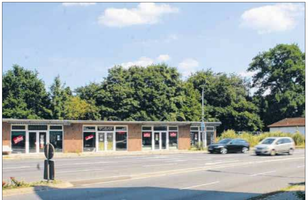
Trauriger Anblick: Die verwaiste Ladenzeile und das von Unkraut überwucherte Grundstück des Drei Kronen ist keine schöne Visitenkarte und den Stockelsdorfern seit langem ein Dorn im Auge.